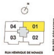
Apto Tipo - Coluna 01