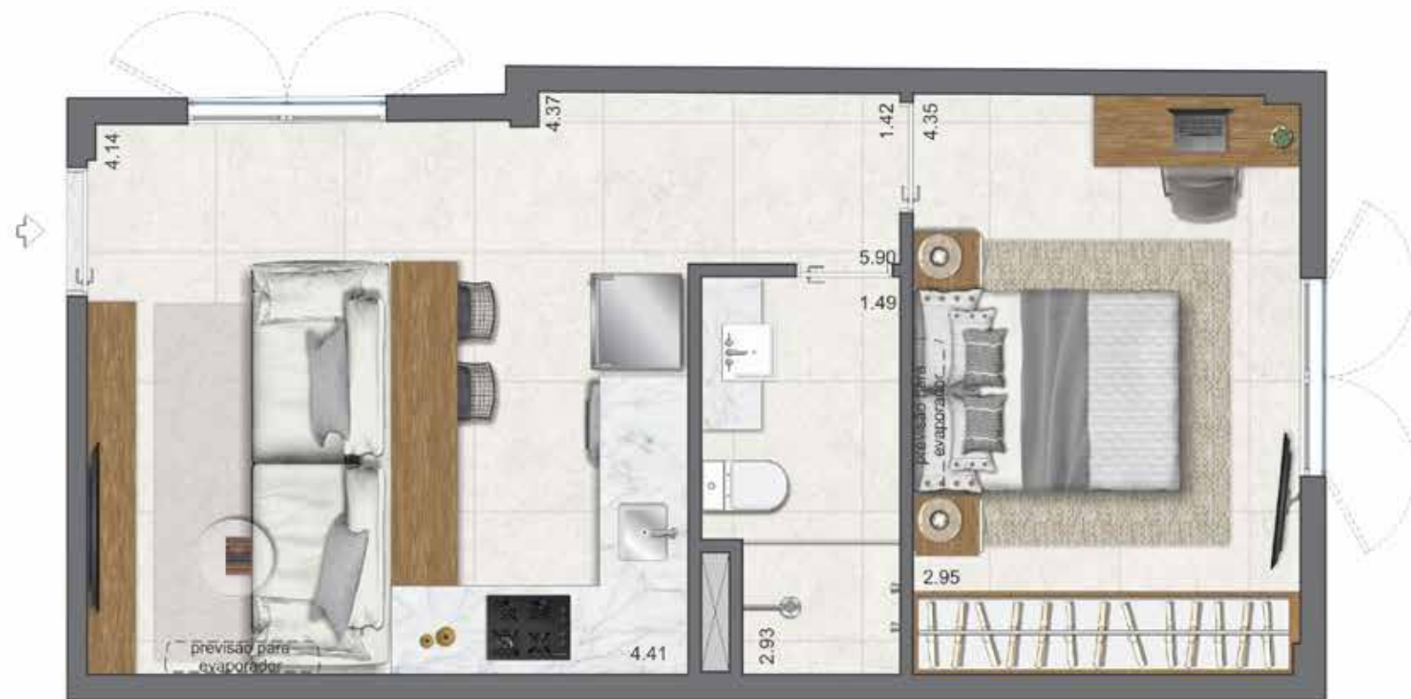
Previsão condensadora em área técnica na cobertura.