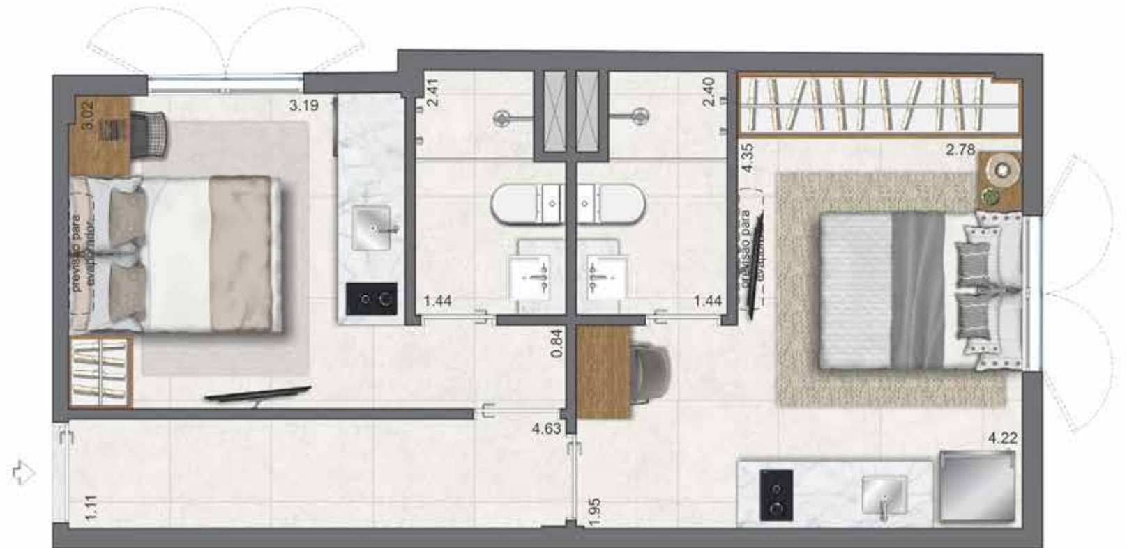
Previsão condensadora em área técnica na cobertura.