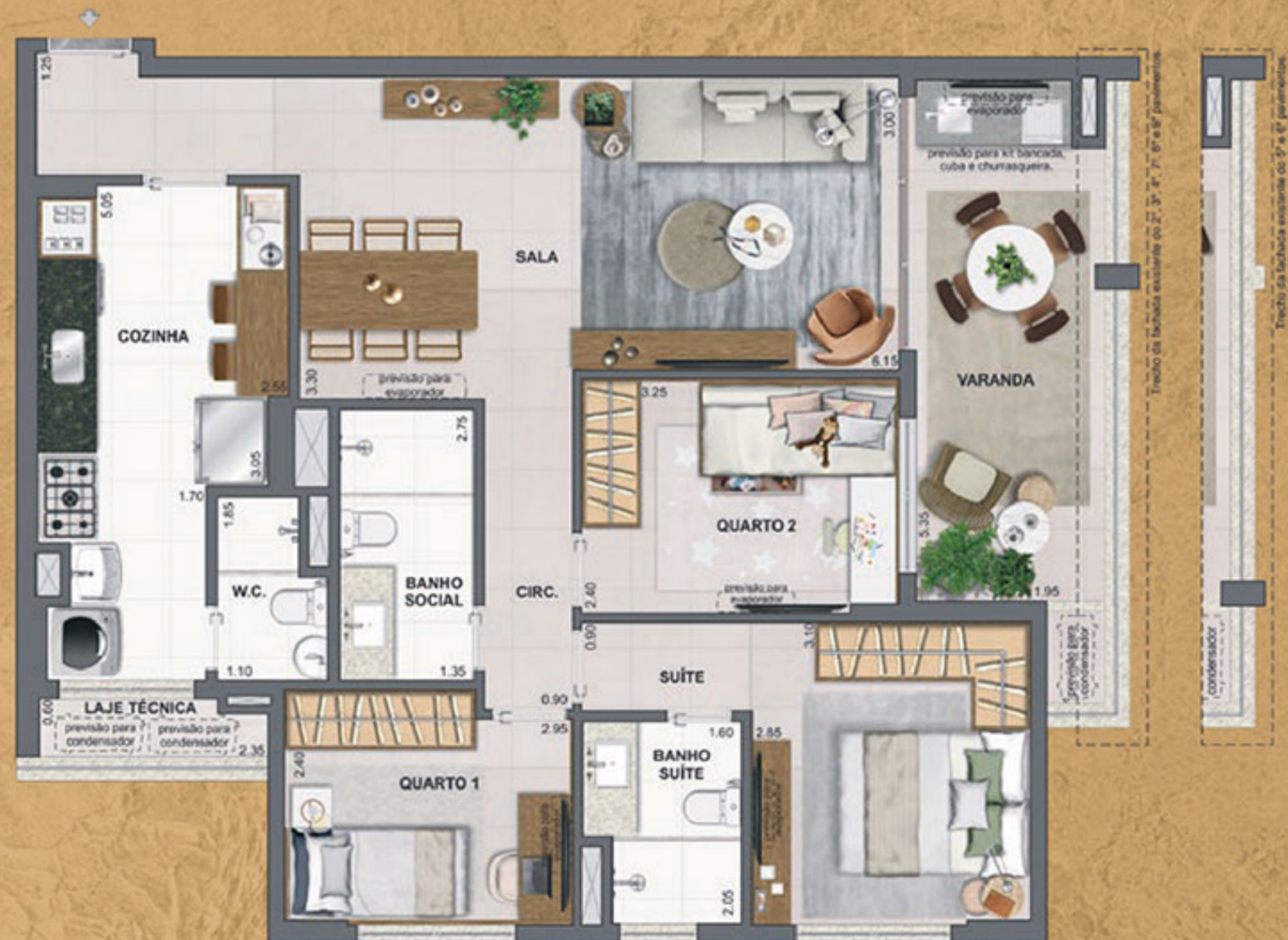
COLUNAS 01, 04, 05 e 08 2º ao 9º Pavimento

ED. PRIVILEGE E PREMIUM Área privativa: 201 a 901, 204 a 904, 205 a 905 e 208 a 908 – 95,75m 2 1001, 1002, 1003 e 1004 – 95,68m 2