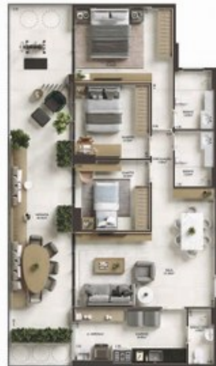
202 a 1002 COLUNA 2 Área Privada 4 107,60m²