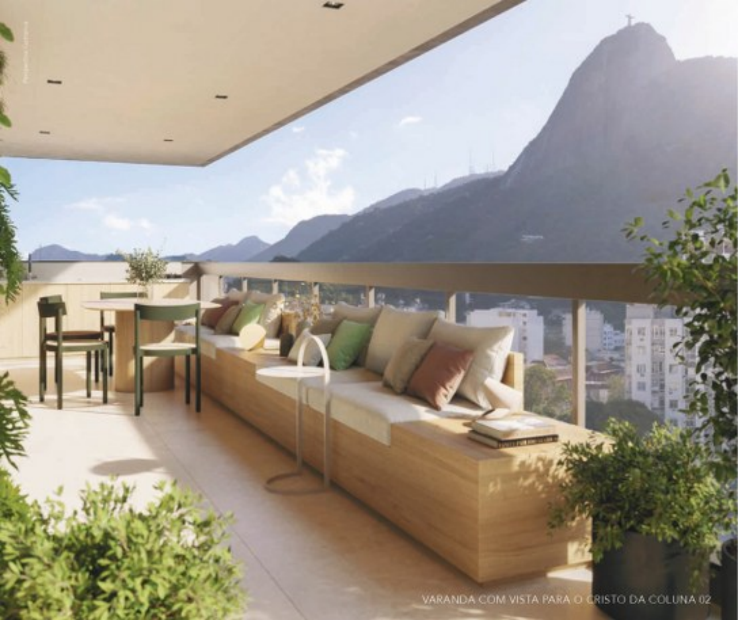
VARANDA COM VISTA PARA O CRISTO DA COLUNA 02