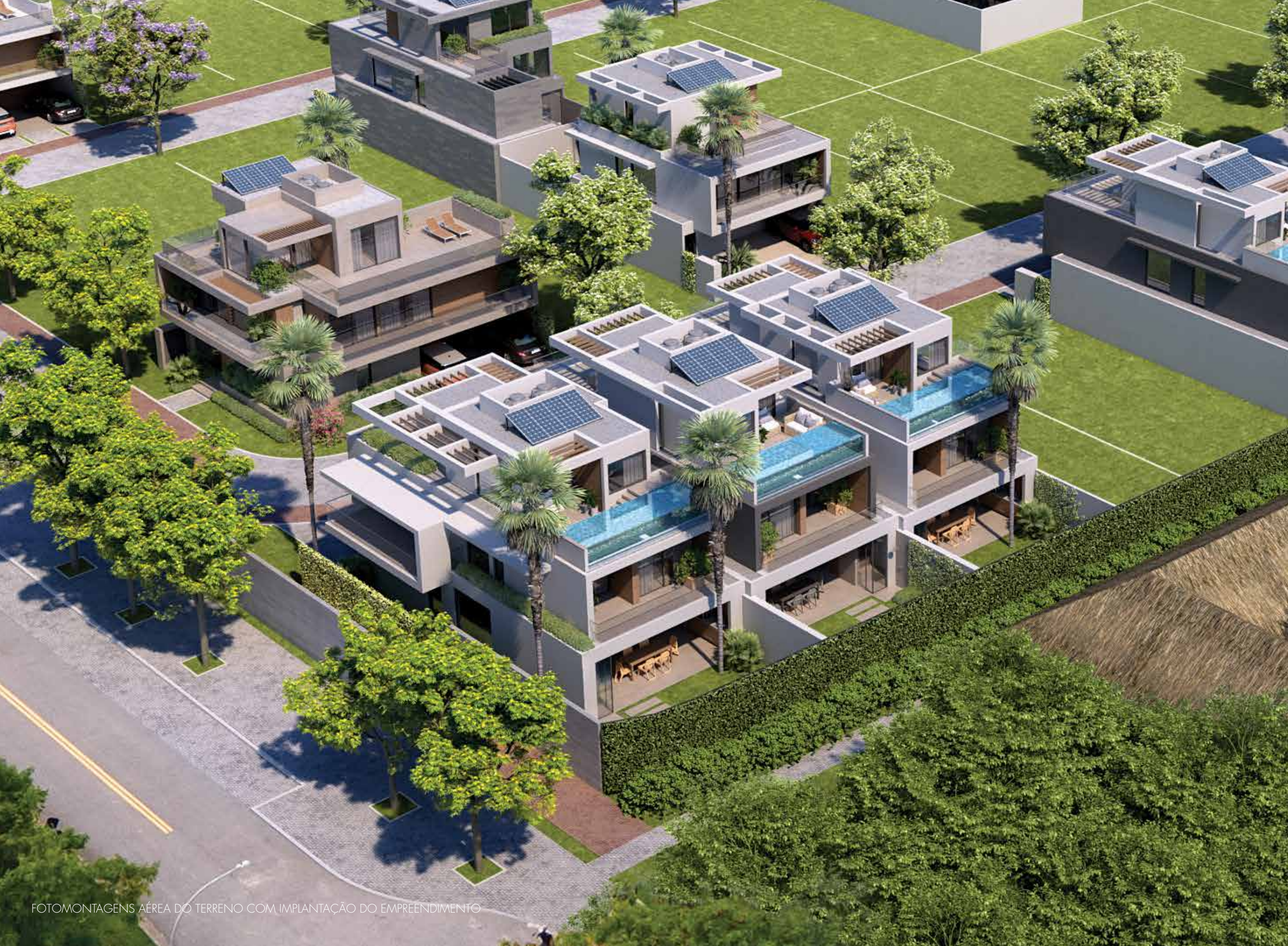
FOTOMONTAGENS AÉREA DO TERRENO COM IMPLANTAÇÃO DO EMPREENDIMENTO