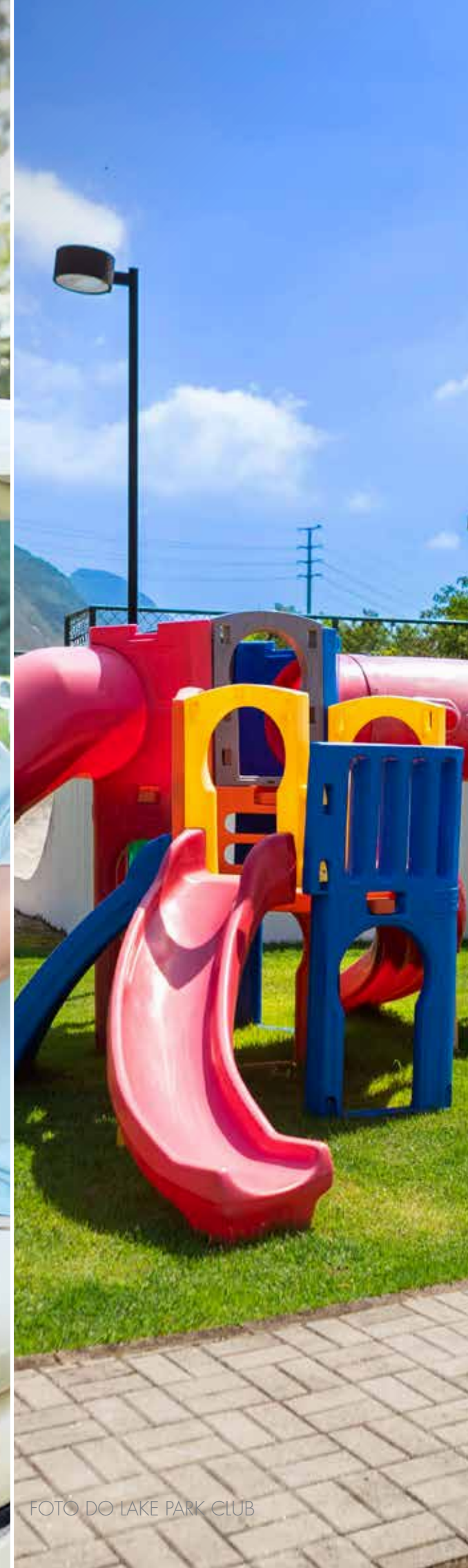
FOTO DO LAKE PARK CLUB