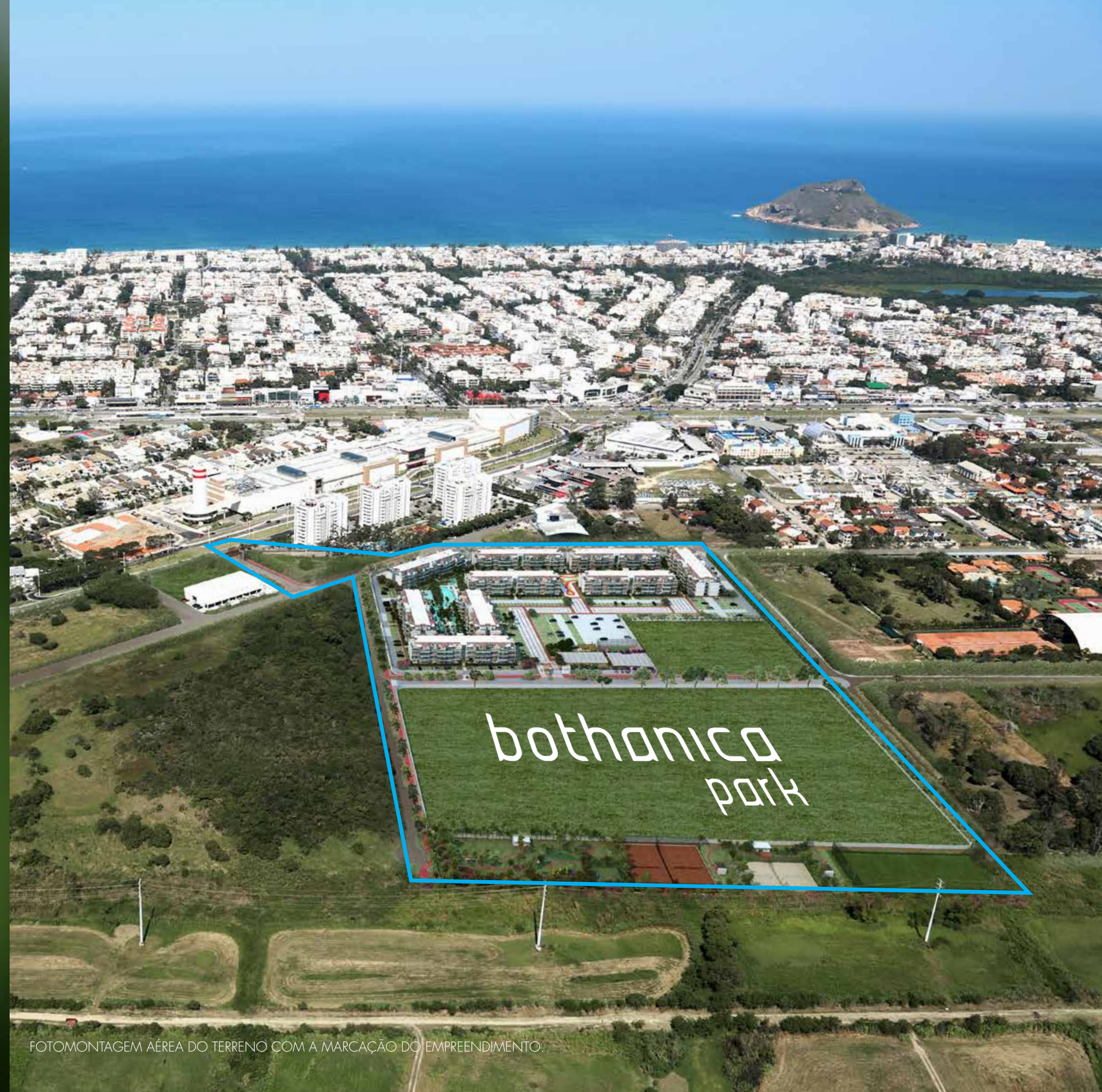
FOTOMONTAGEM AÉREA DO TERRENO COM A MARCAÇÃO DO EMPREENDIMENTO.

Um bairro nascido em meio à uma natureza exuberante e que garante a mistura perfeita entre privacidade e comodidade para você e toda sua família.