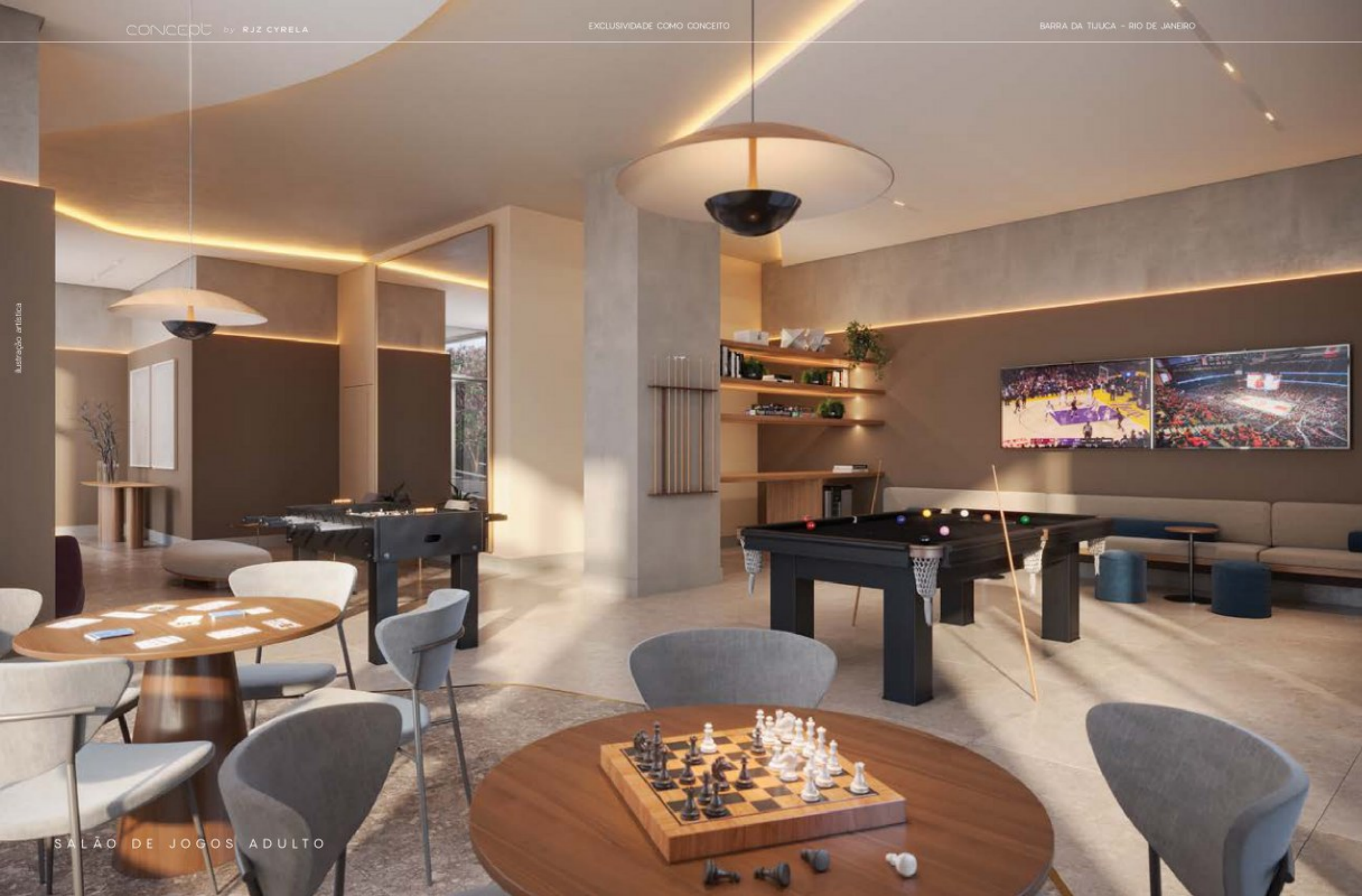
SALÃO DE JOGOS ADULTO