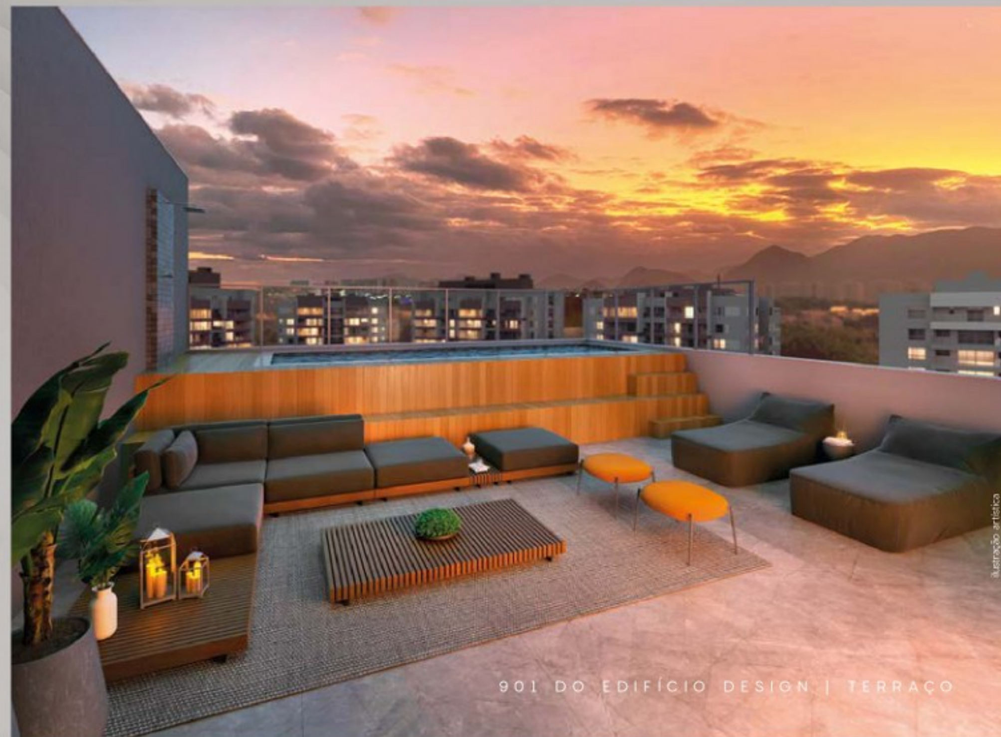
901 DO EDIFÍCIO DESIGN | TERRAÇO