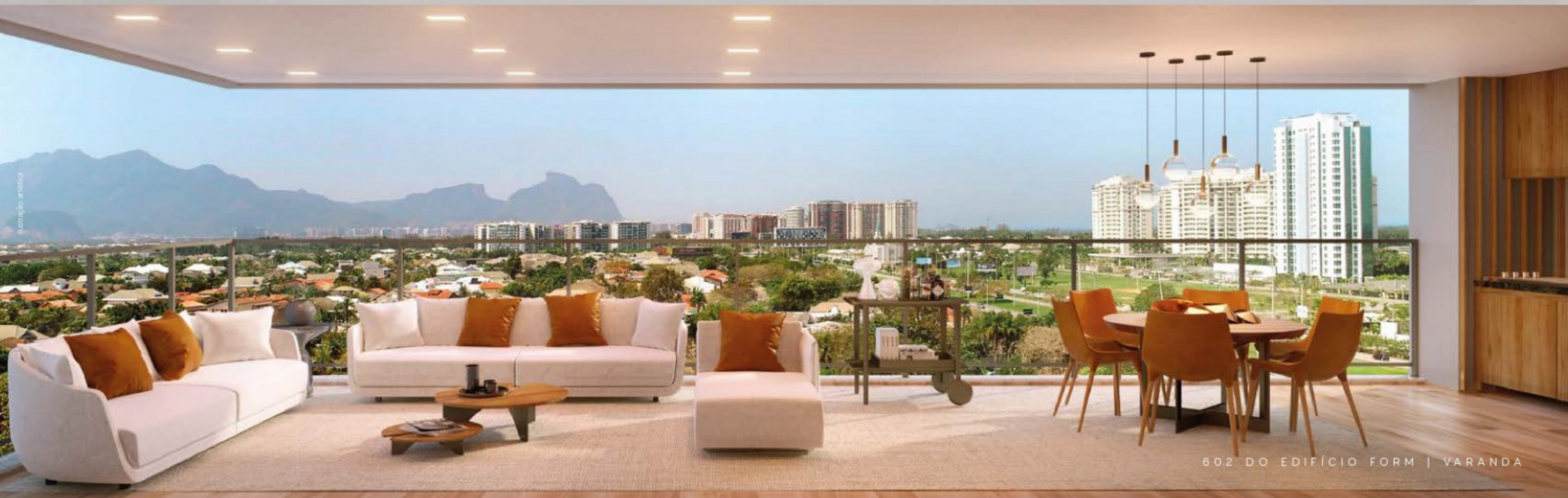
602 DO EDIFÍCIO FORM | VARANDA