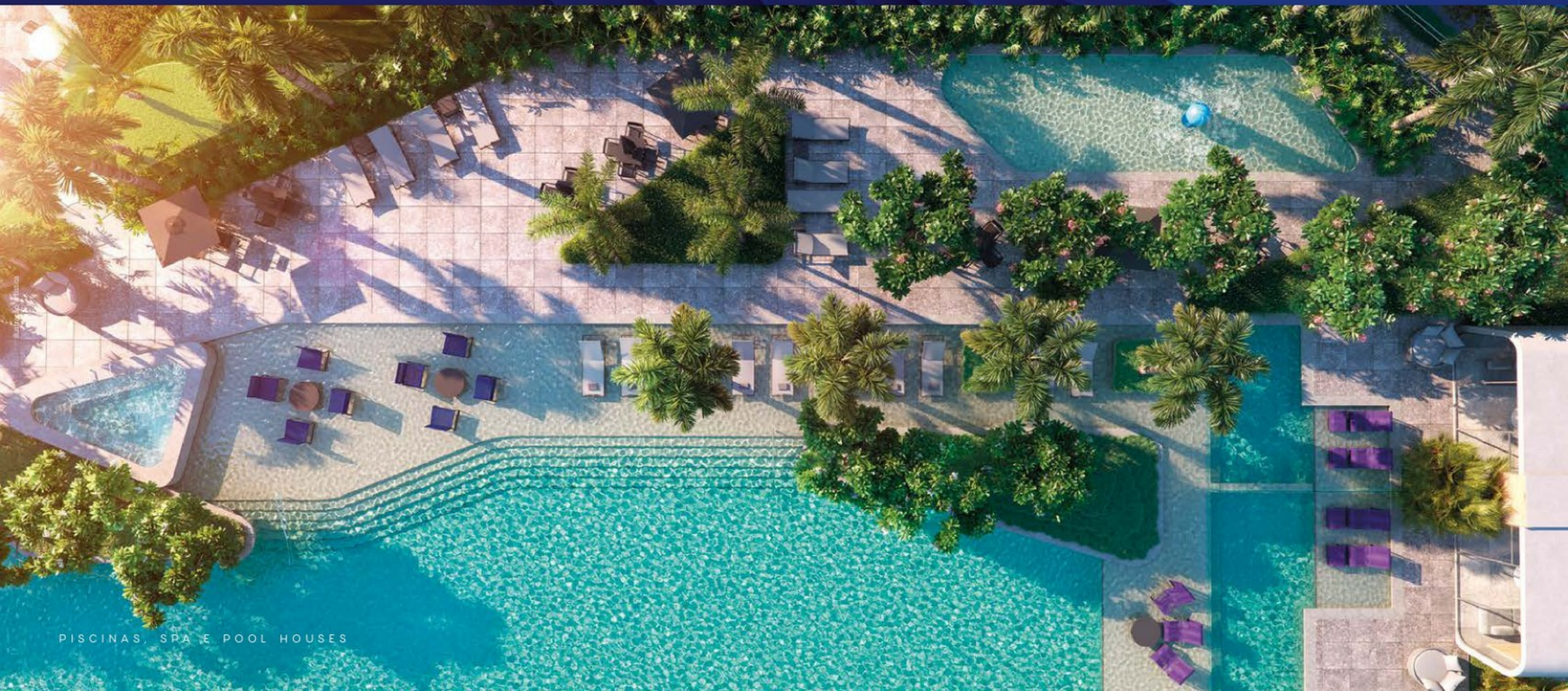
PISCINAS, SPA E POOL HOUSES