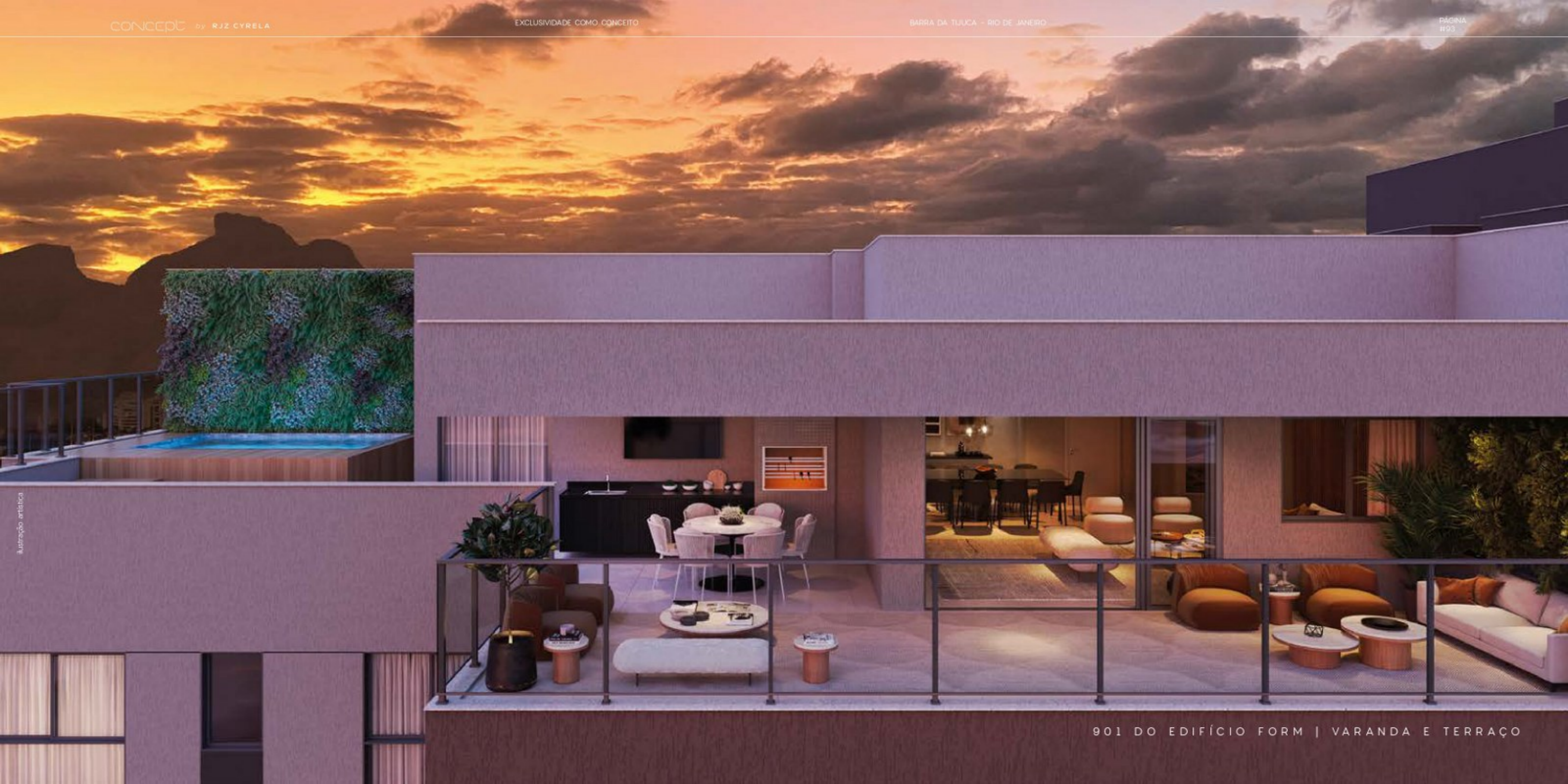
901 DO EDIFÍCIO FORM | VARANDA E TERRAÇO