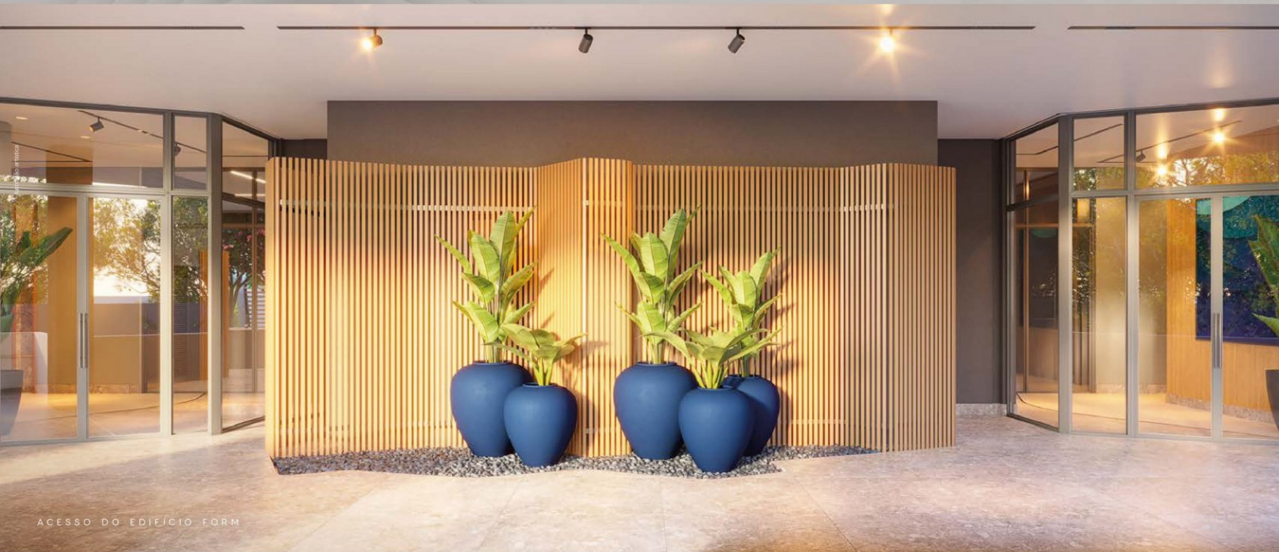
ACESSO DO EDIFÍCIO FORM