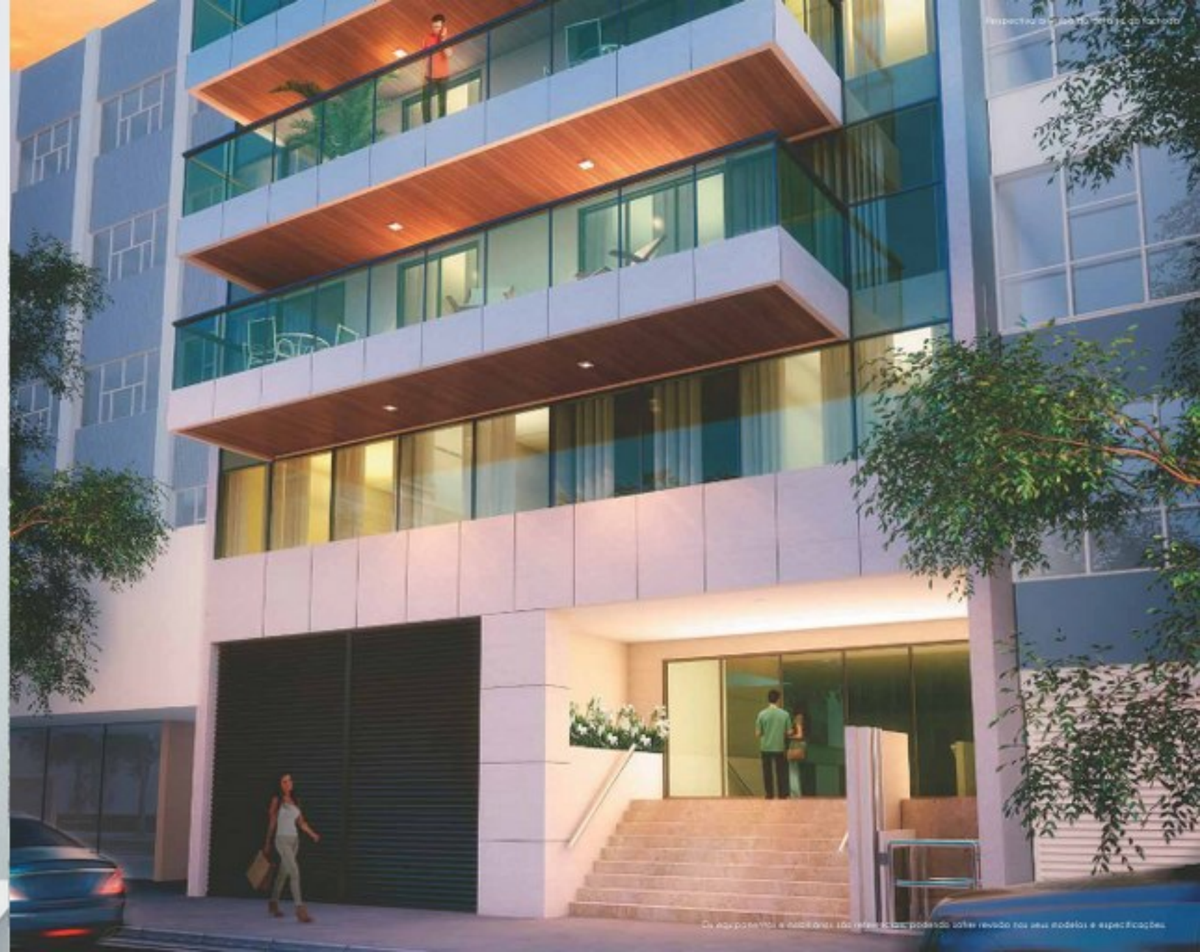
Perspectiva artística da fachada