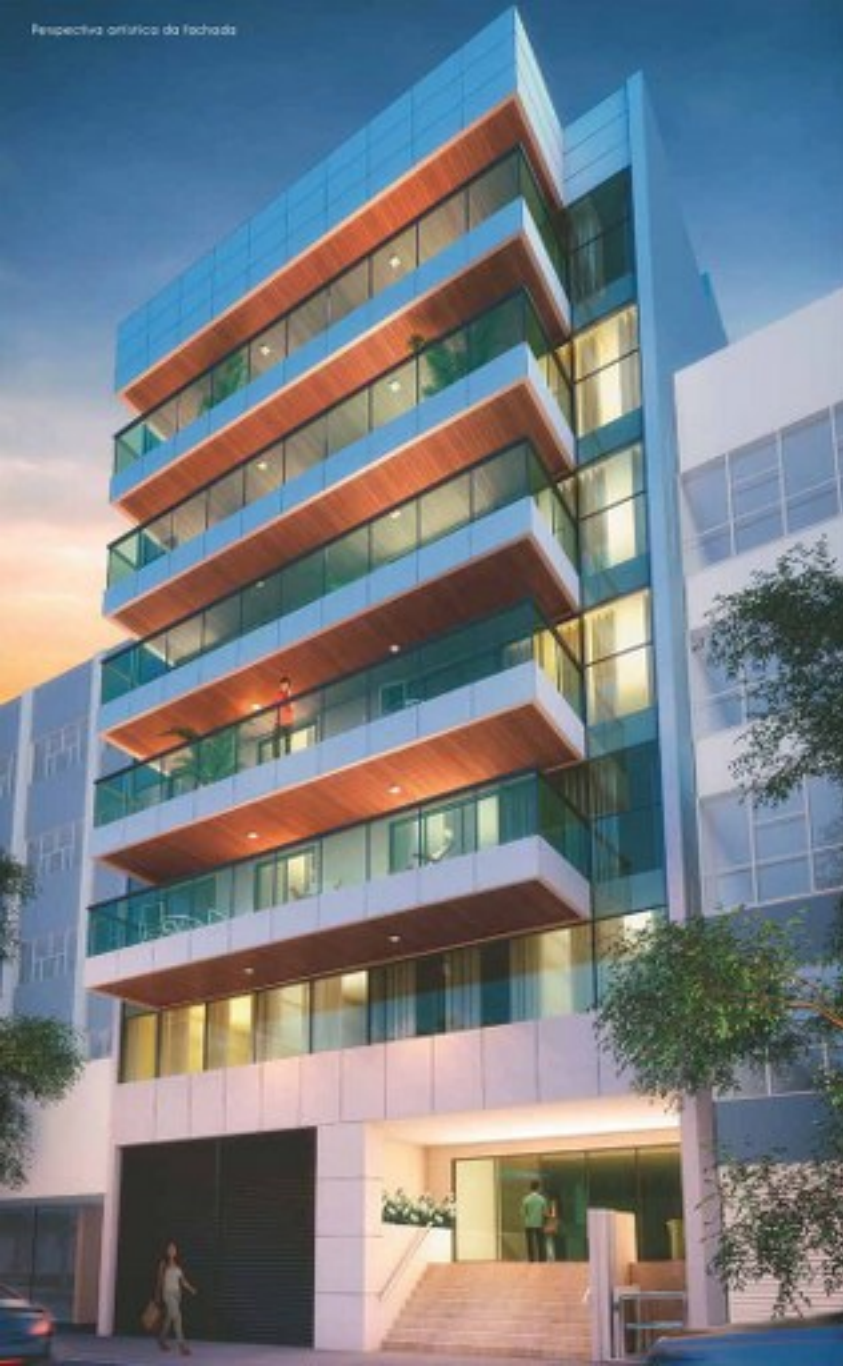
Perspectiva artística da fachada