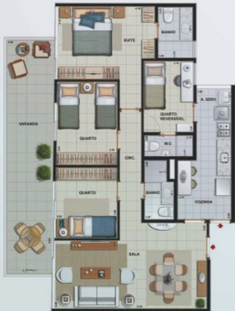
Apto. Tipo - 101 a 501

3 quartos (1 suíte) + dependência reversível Área privativa total: 106,60m 2 2 vagas na garagem