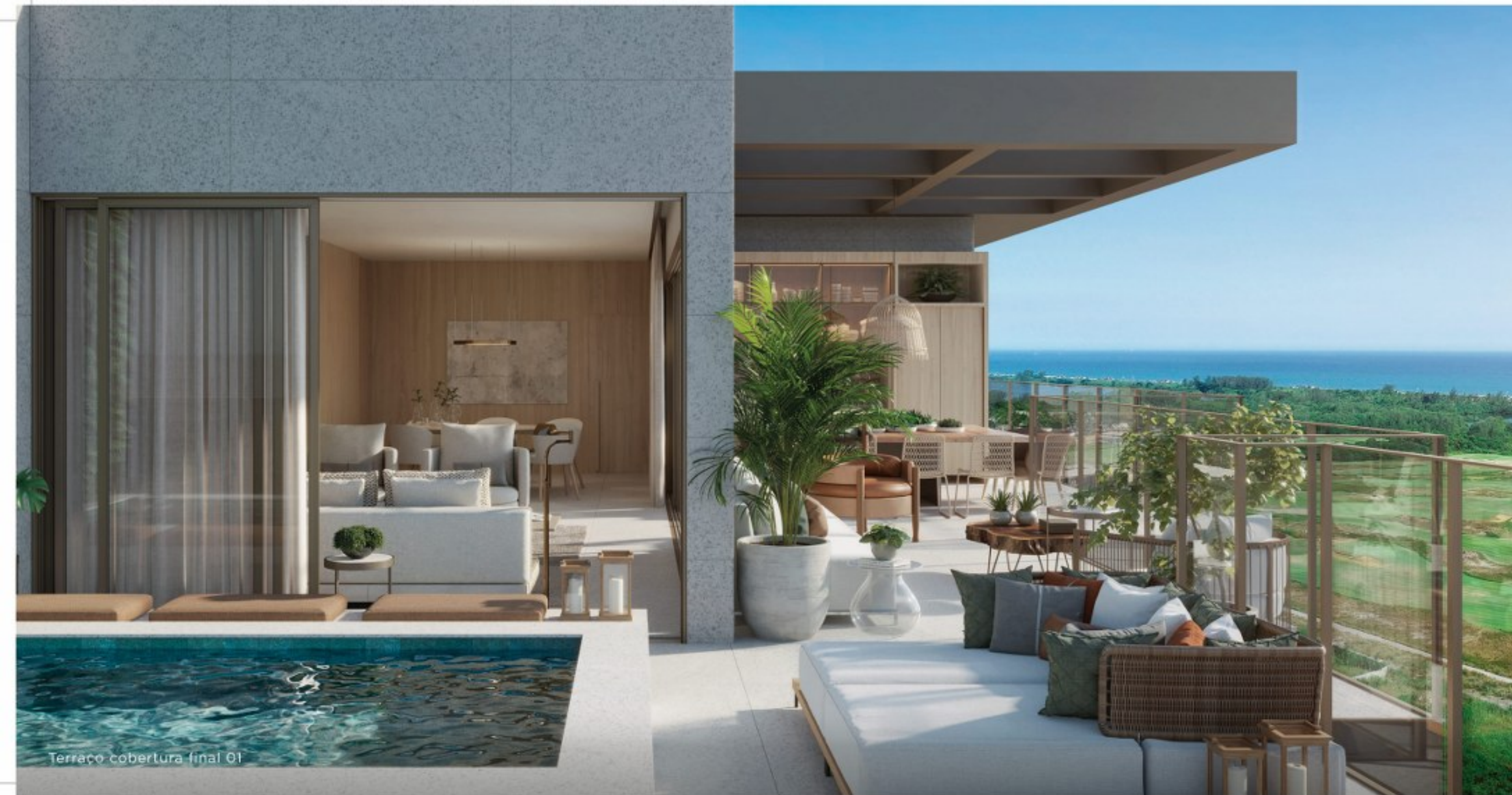
Terraço cobertura final 01