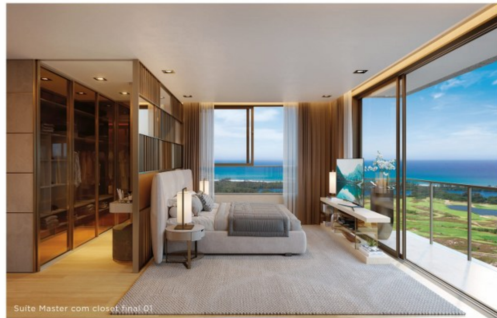
Suite Master com closet final 01

*A banheira da suite master da cobertura será entregue. **O piso em porcelanato nos quartos e circulação faz parte de um kit opcional que poderá ser adquirido pelo proprietário após a aquisição do apartamento. Consultar memorial descritivo específico.