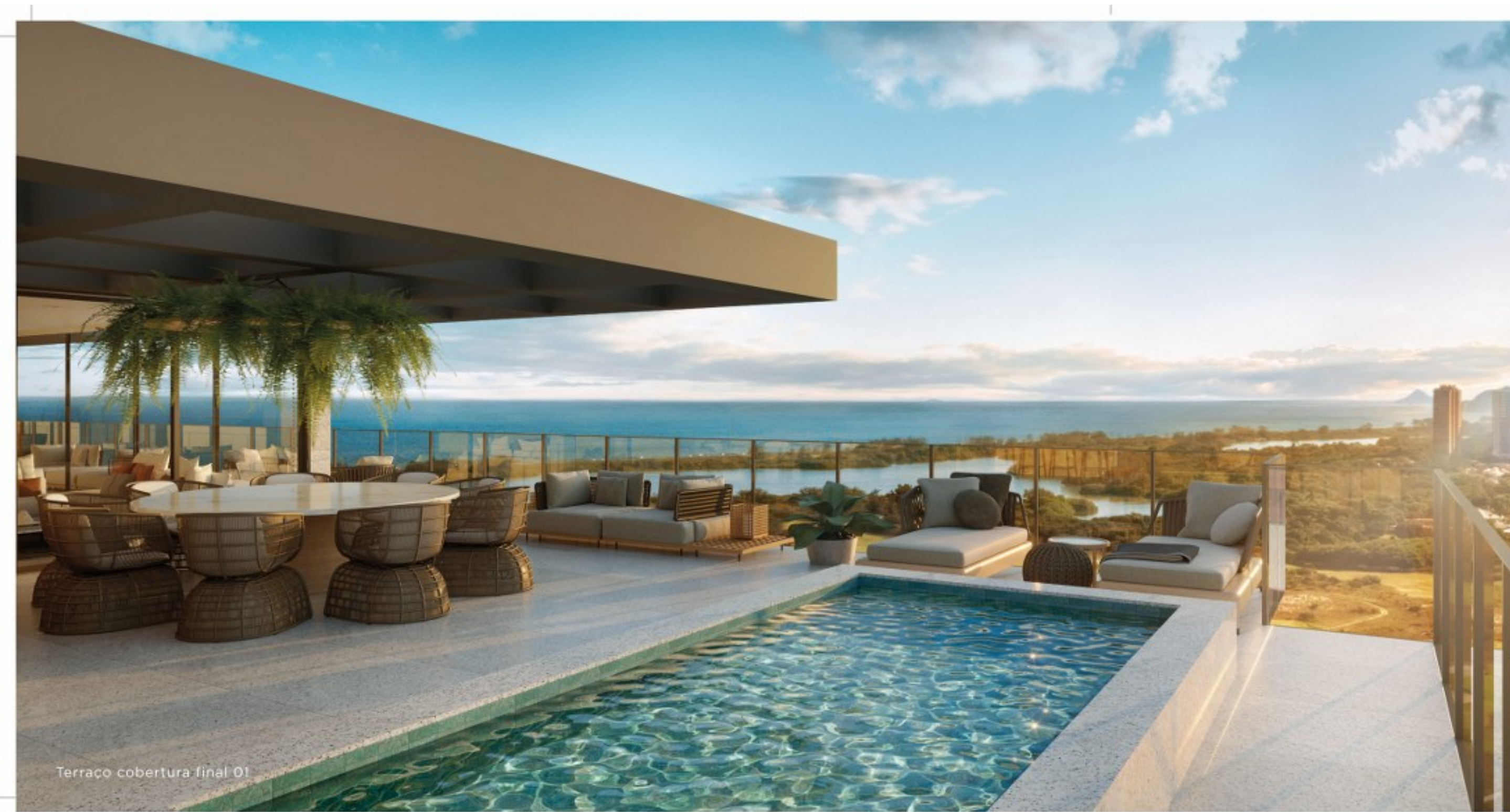
Terraco cobertura final 01