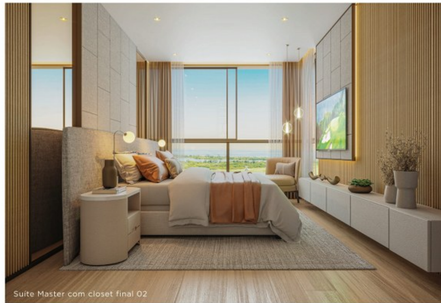
Suite Master com closet final 02