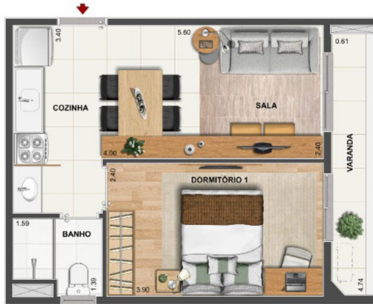
BLOCO 2 APARTAMENTO TIPO