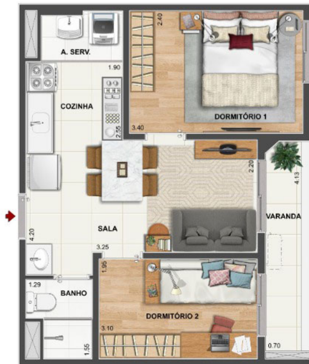
BLOCO 1 APARTAMENTO TIPO Colunas 03, 15, 16 e 19