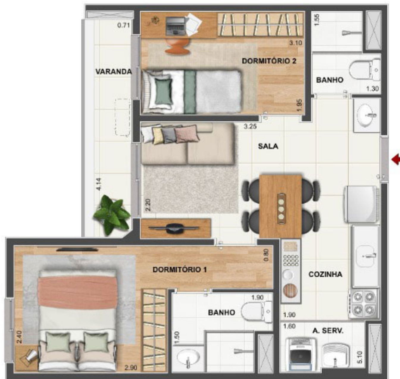
BLOCO 2 APARTAMENTO TIPO Colunas 03, 06, 07 e 19