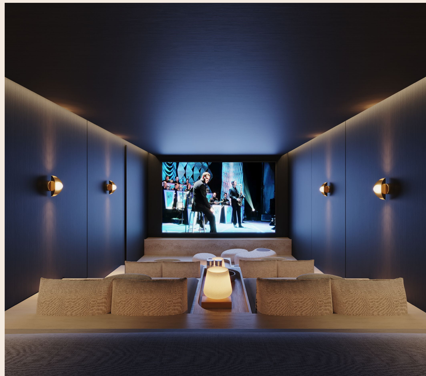
Onde você é a estrela