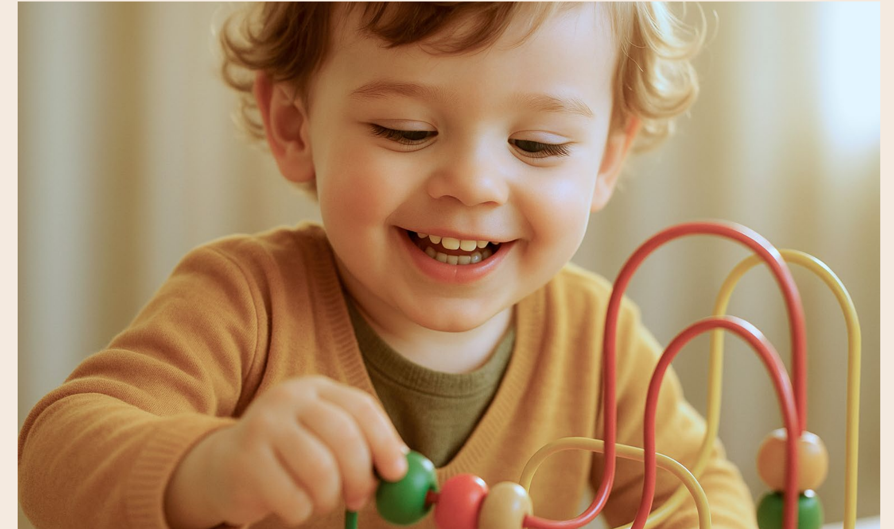
Brinquedos e brincadeiras sem fim