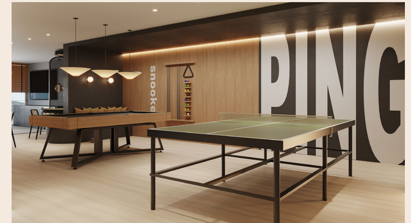
Aqui a diversão sempre sai ganhando