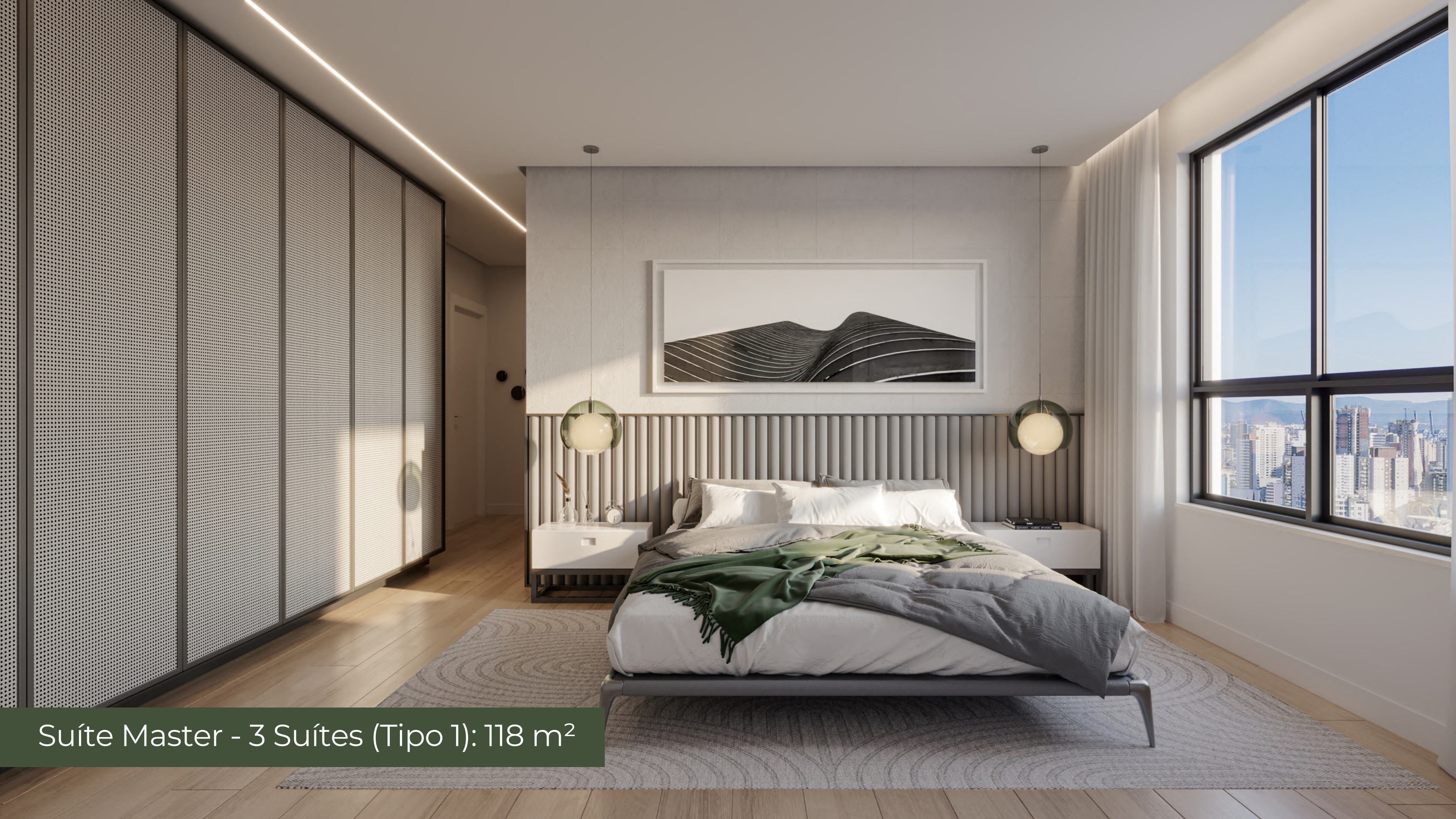
Suíte Master - 3 Suítes (Tipo 1): 118 m 2