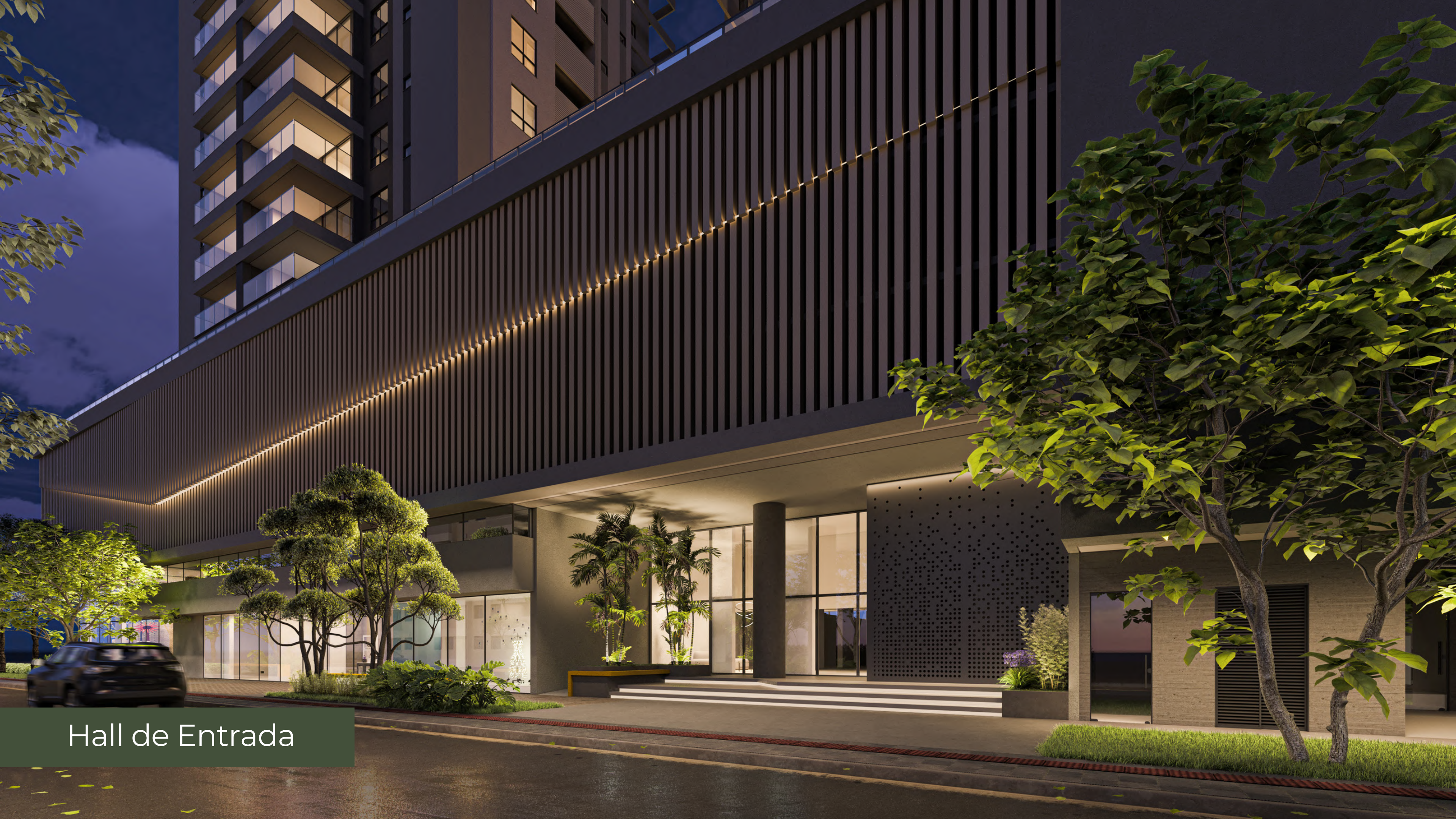
Hall de Entrada