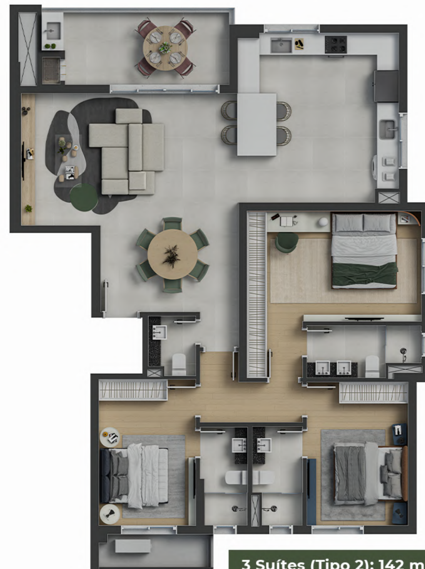
3 Suítes (Tipo 2): 142 m 2 2 vagas de garagem