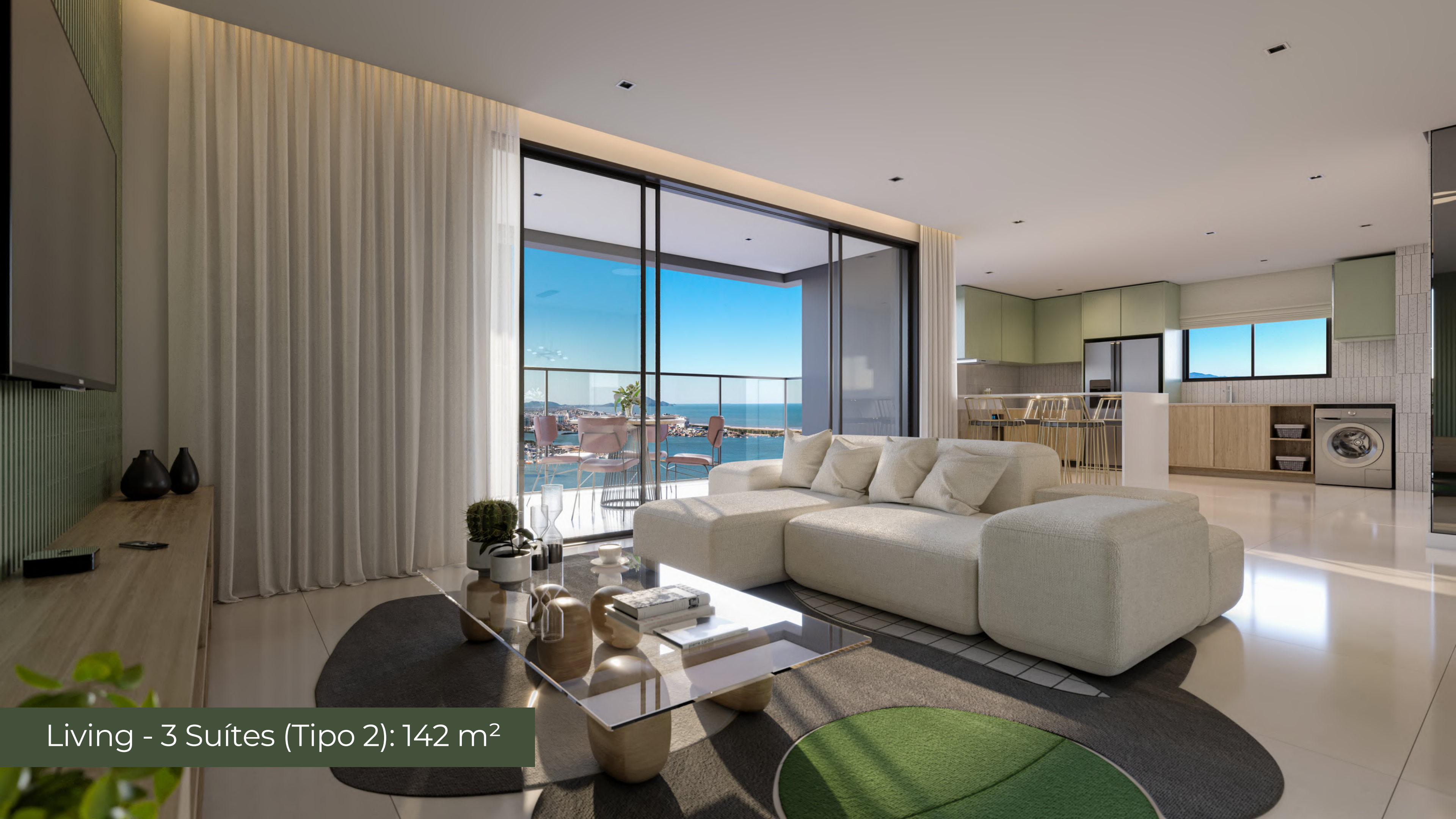
Living - 3 Suítes (Tipo 2): 142 m 2