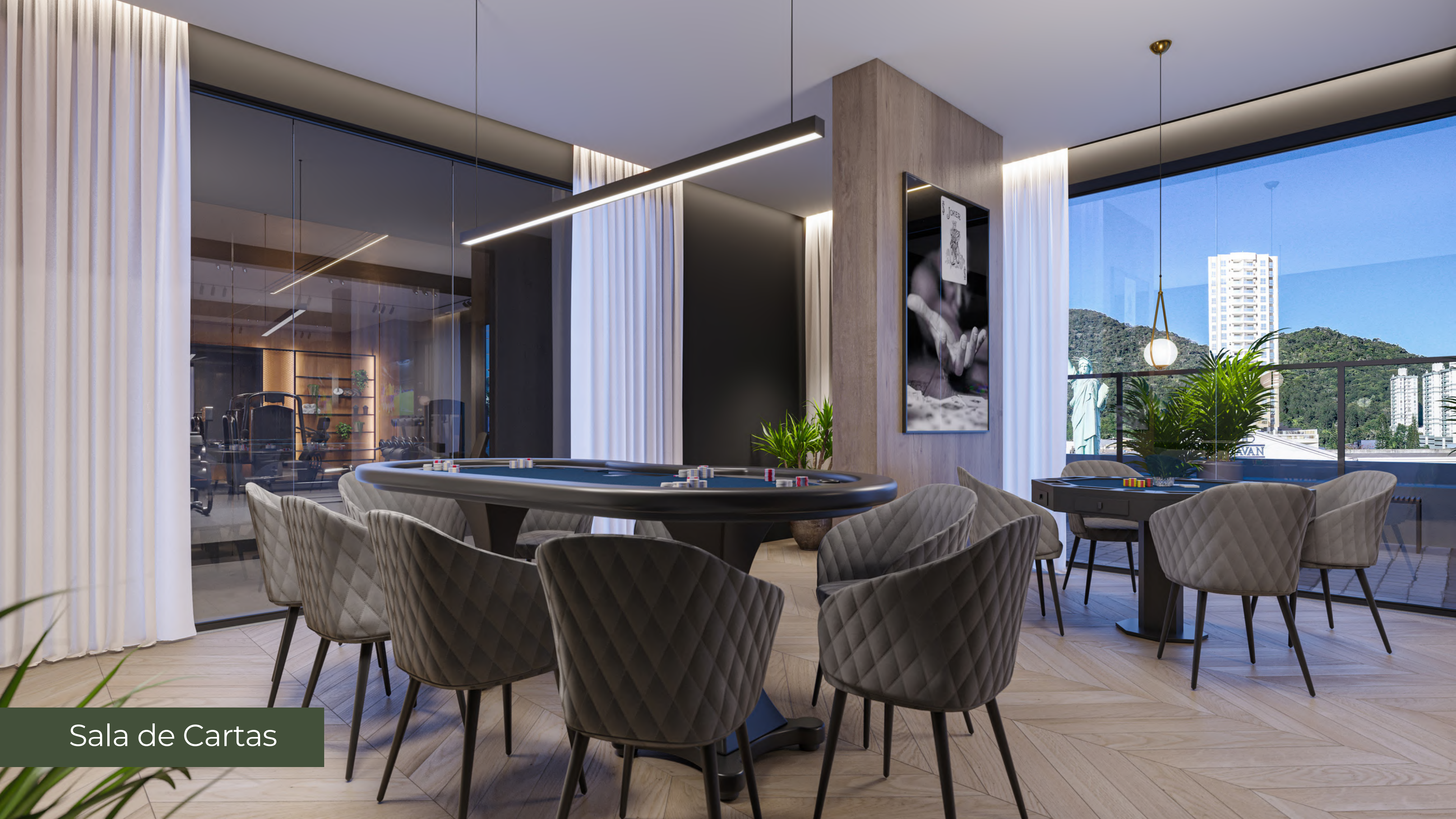
Sala de Cartas