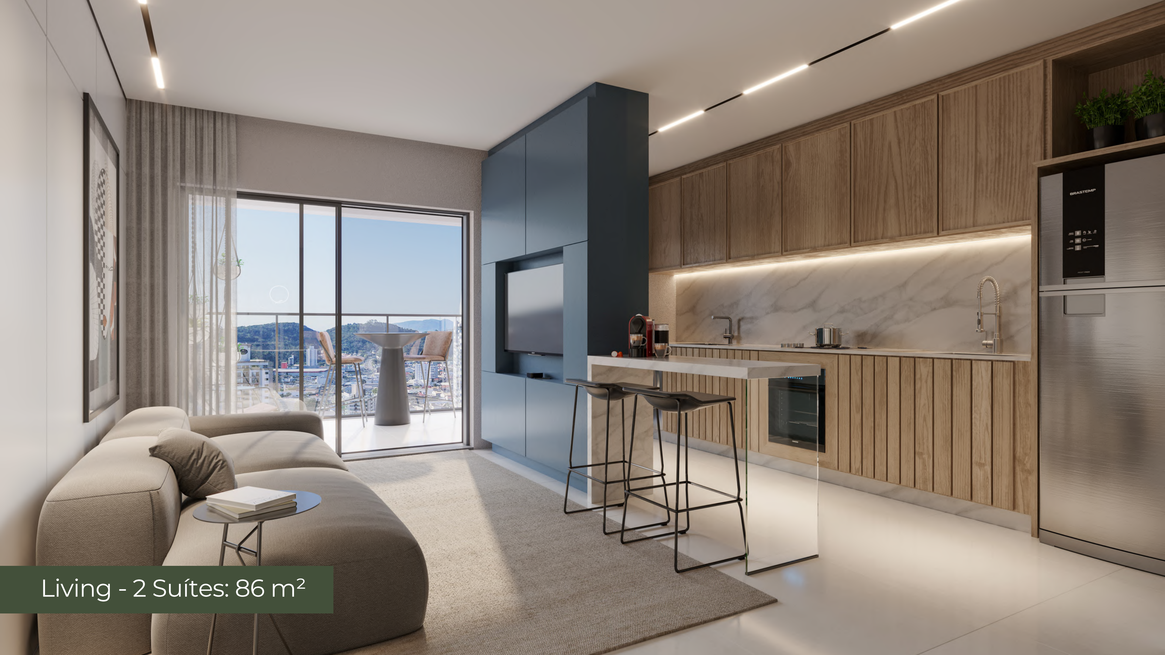
Living - 2 Suítes: 86 m 2