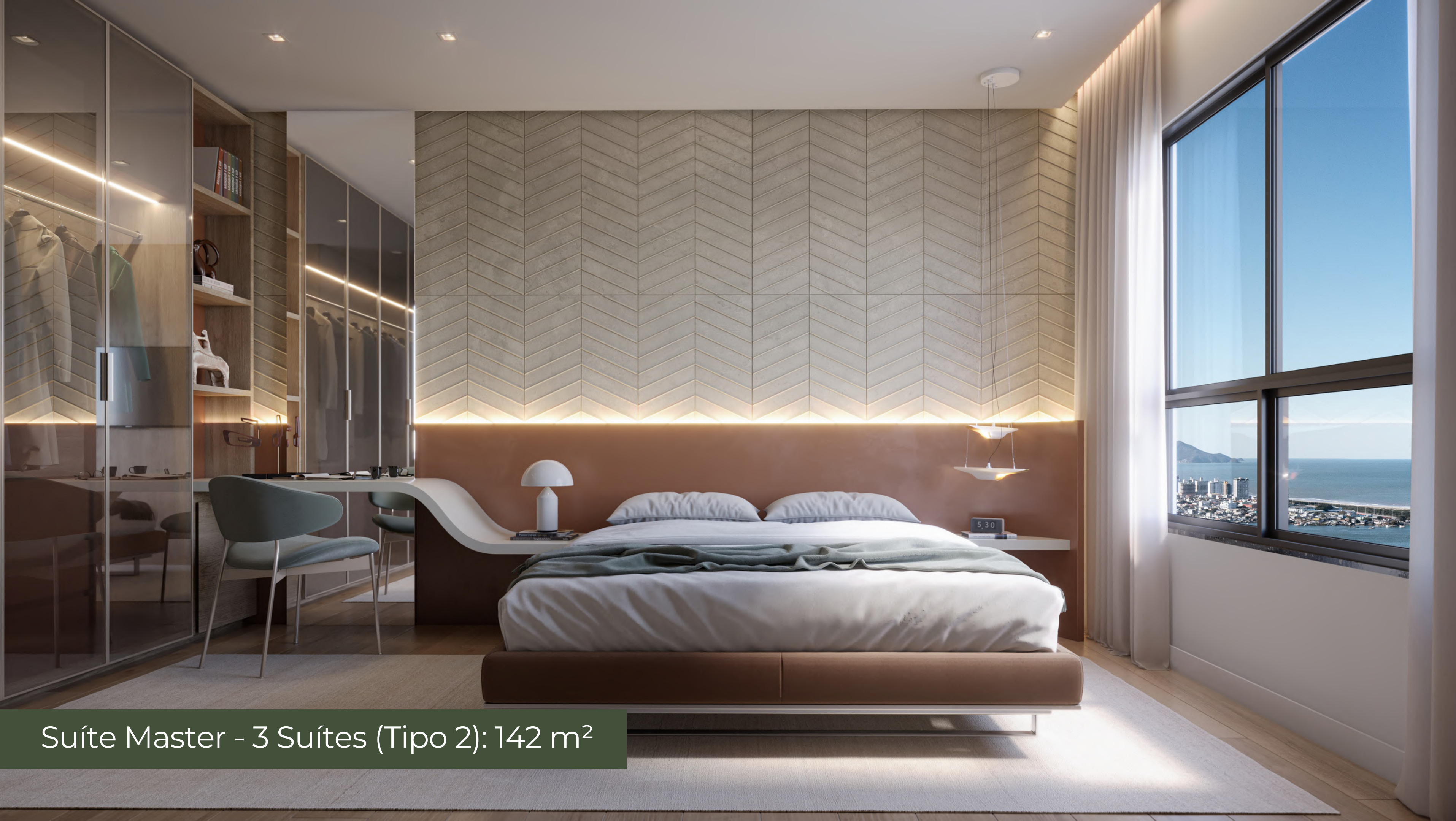
Suíte Master - 3 Suítes (Tipo 2): 142 m 2