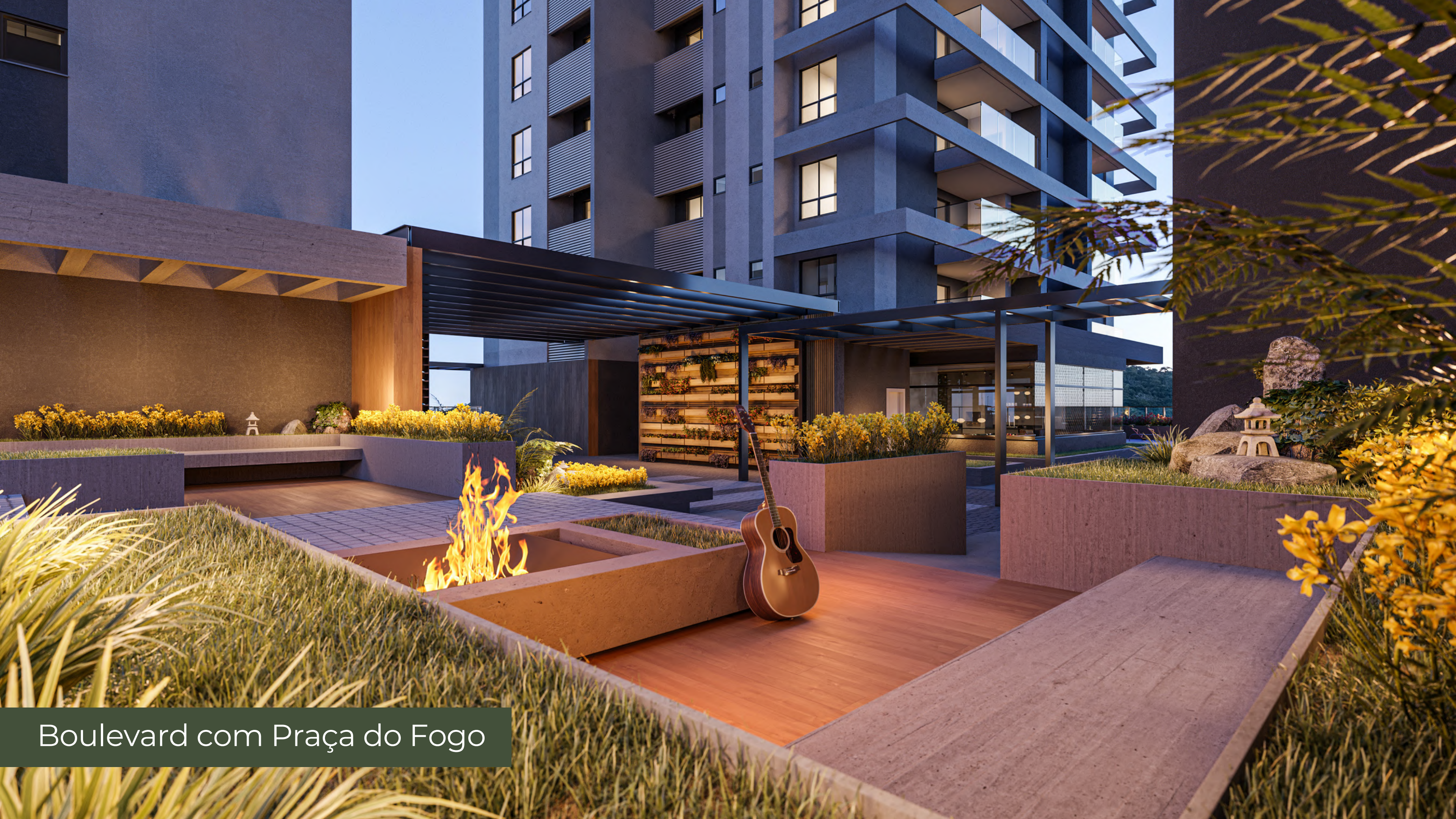
Boulevard com Praça do Fogo