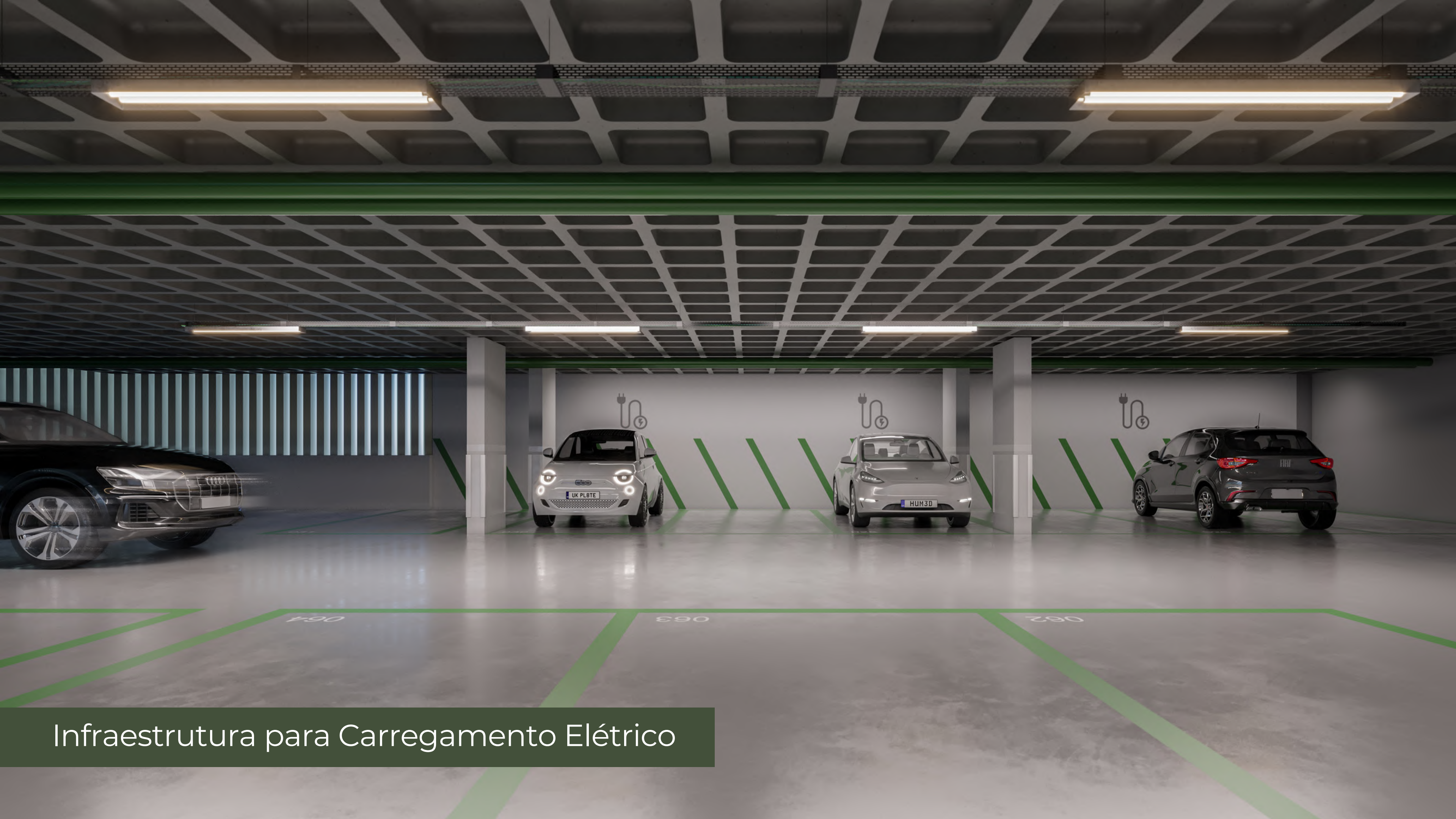
Infraestrutura para Carregamento Elétrico