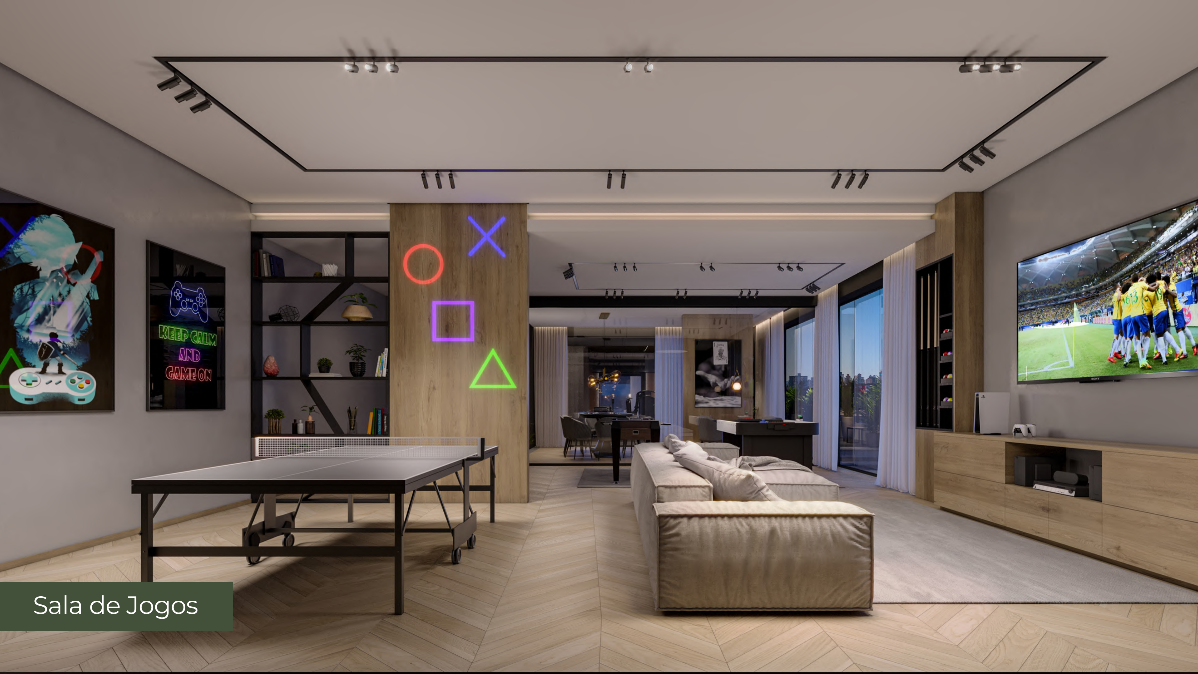
Sala de Jogos