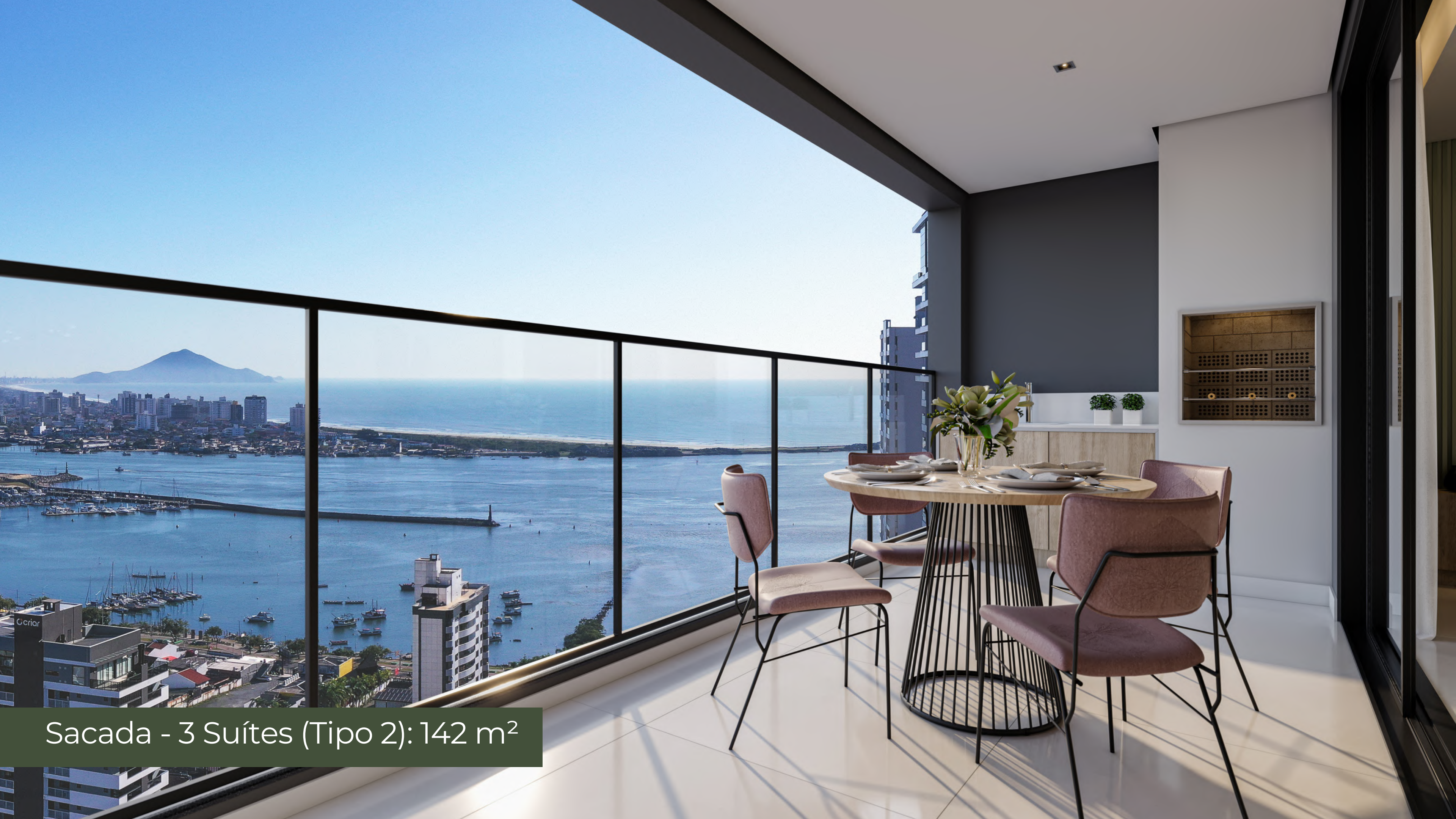
Sacada - 3 Suítes (Tipo 2): 142 m 2