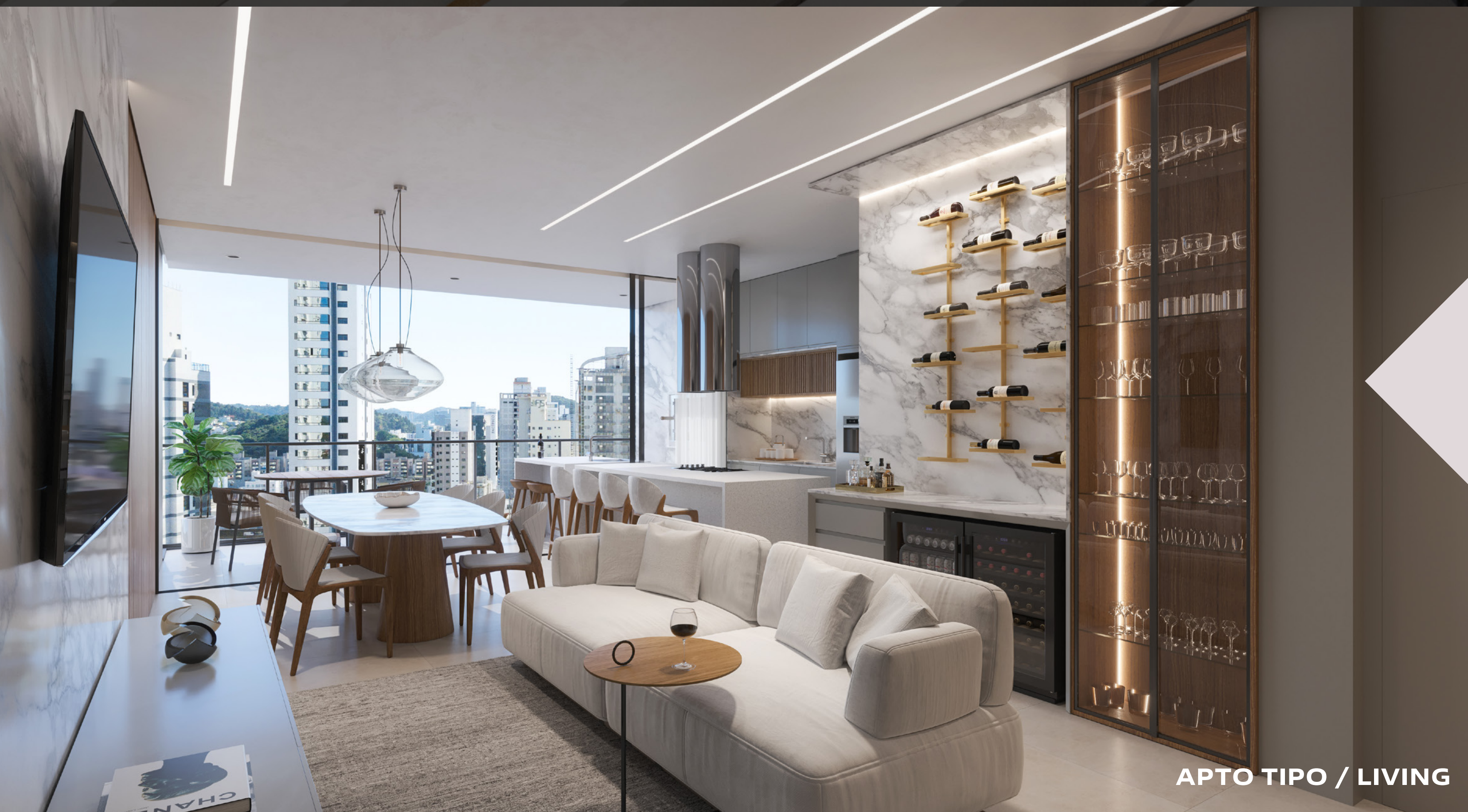
APTO TIPO / LIVING