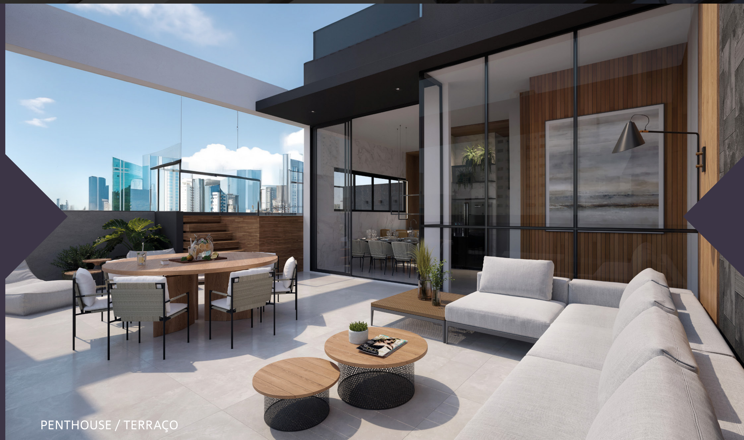
PENTHOUSE / TERRAÇO