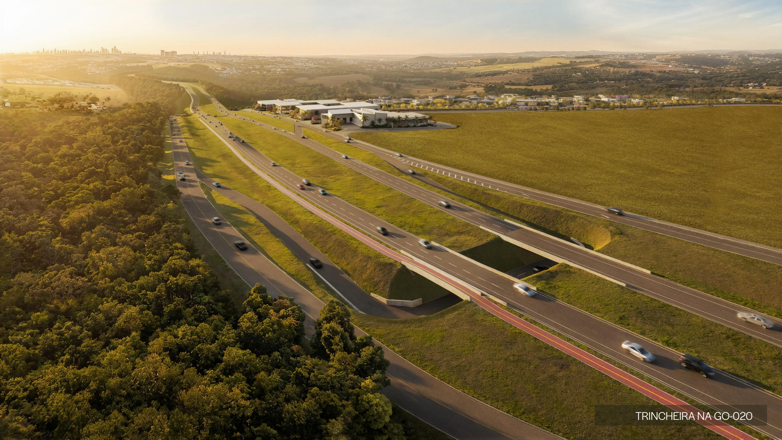
TRINCHEIRA NA GO-020