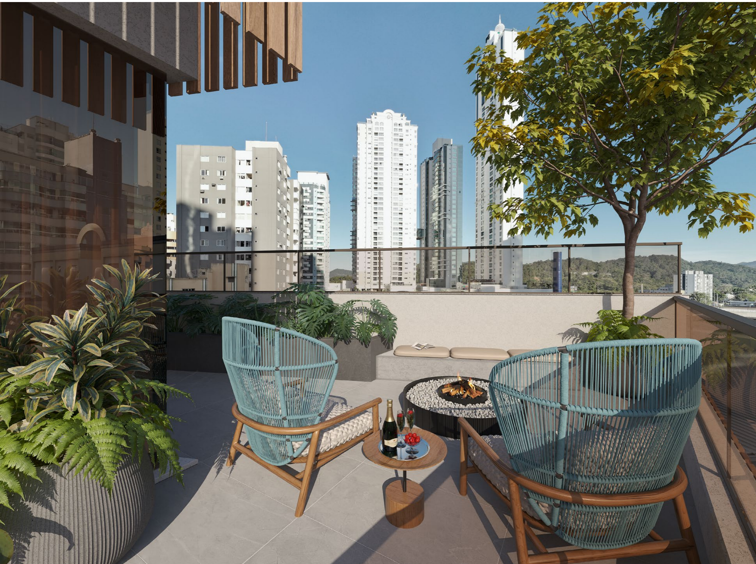
ESPAÇO FOGO integrado com salão de festas