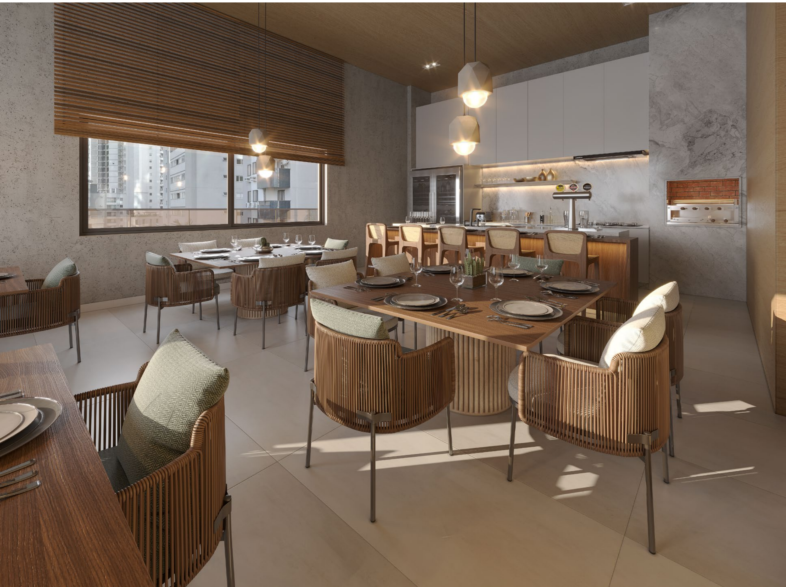
ESPAÇO GOURMET para aprox. 40 pessoas