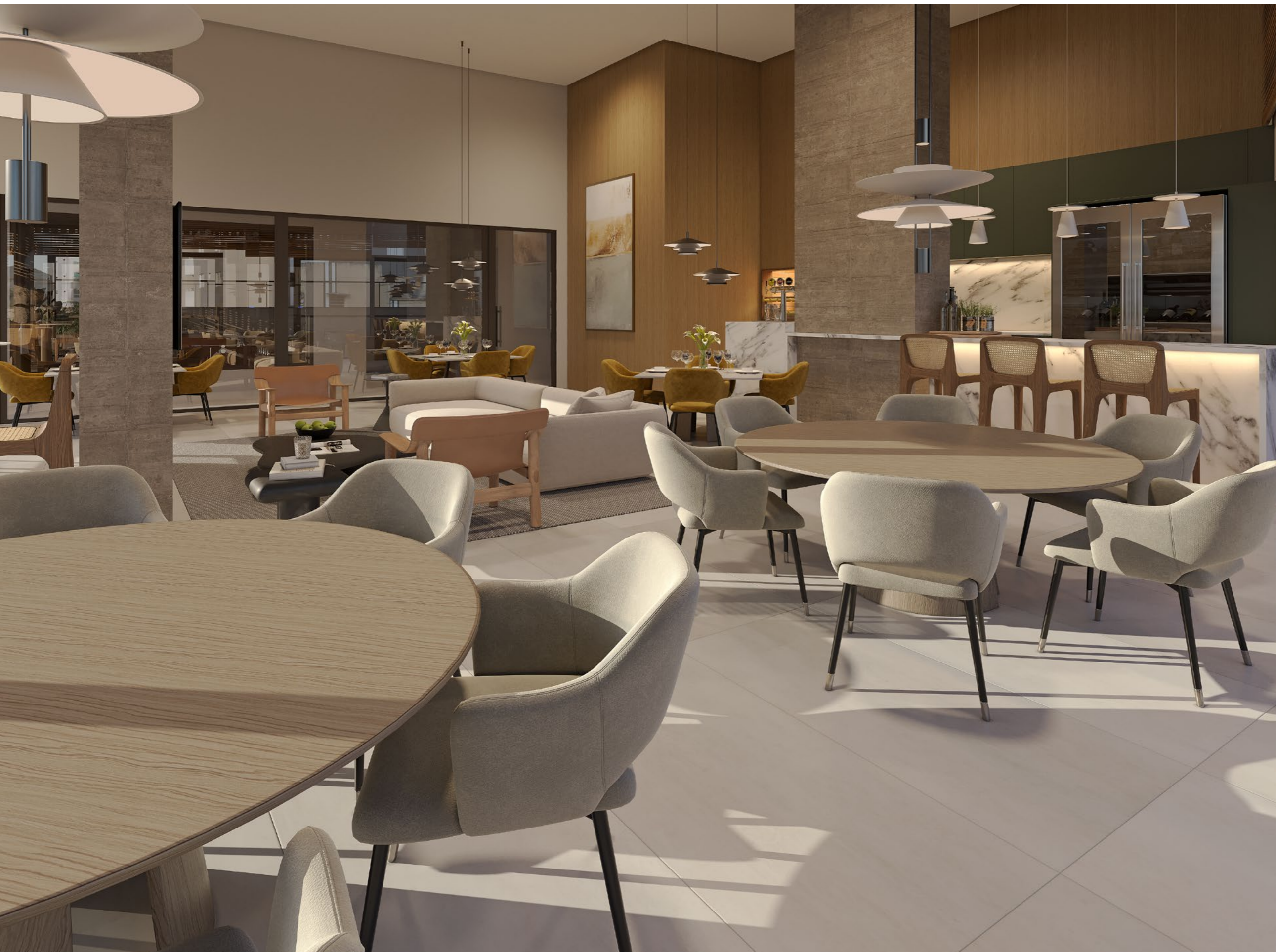
SALÃO DE FESTAS equipado e decorado