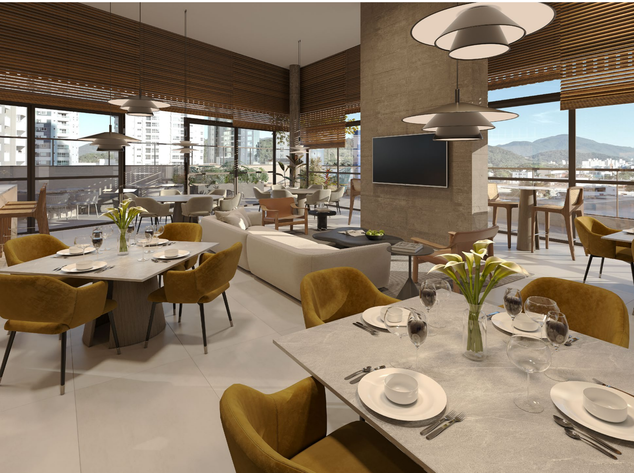
SALÃO DE FESTAS para aprox. 60 pessoas