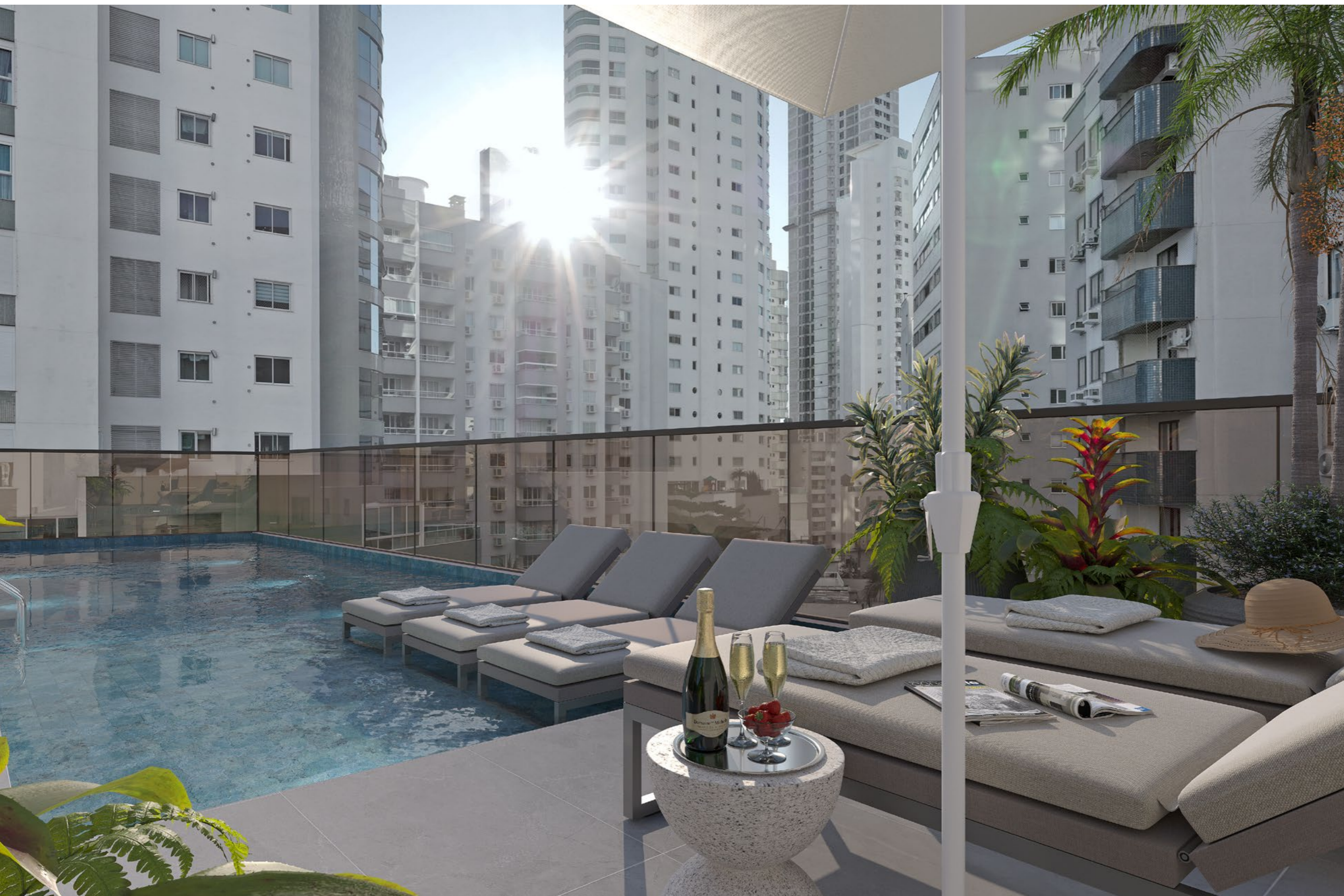
PISCINA com prainha