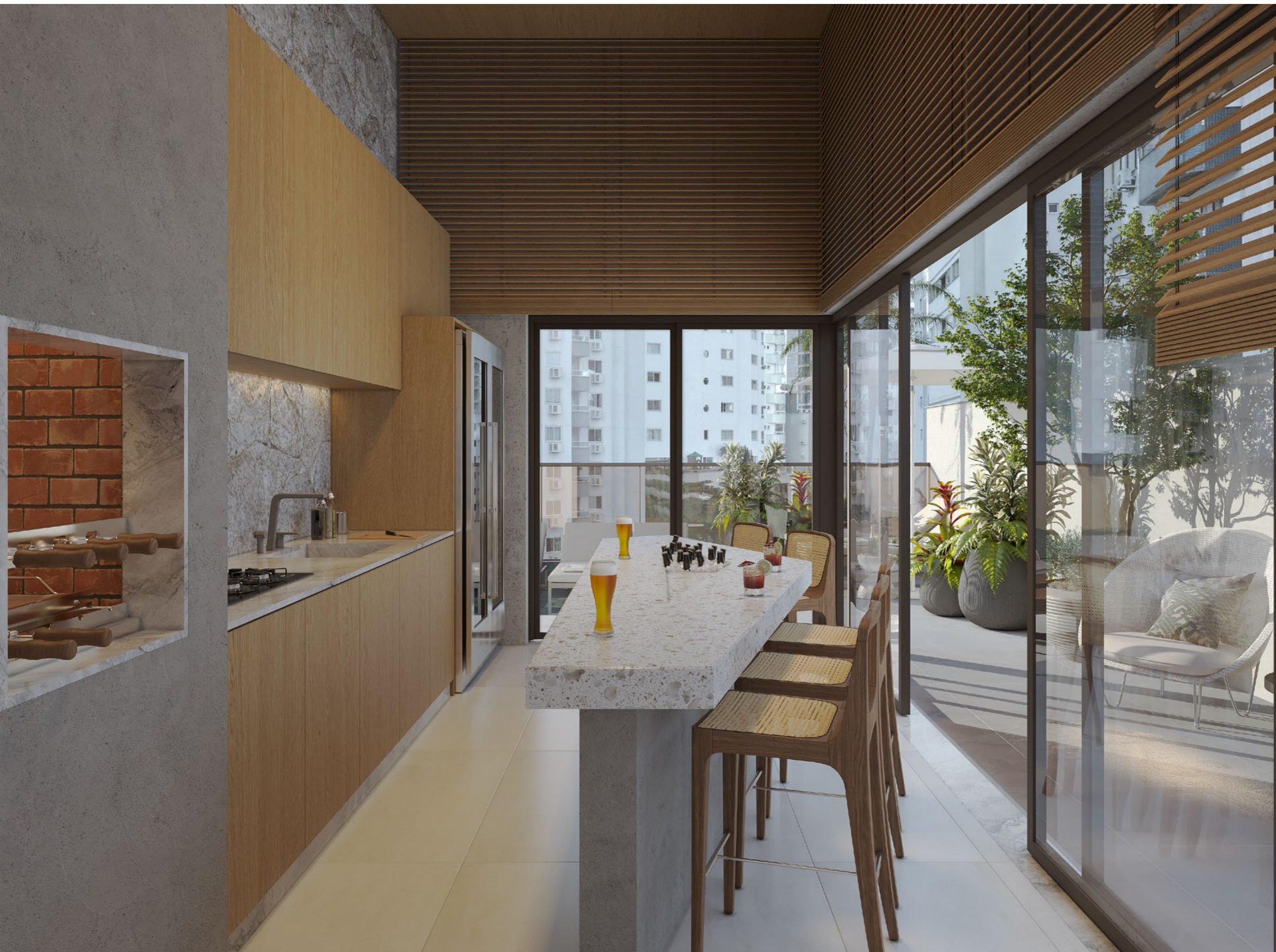
QUIOSQUE integrado com a piscina