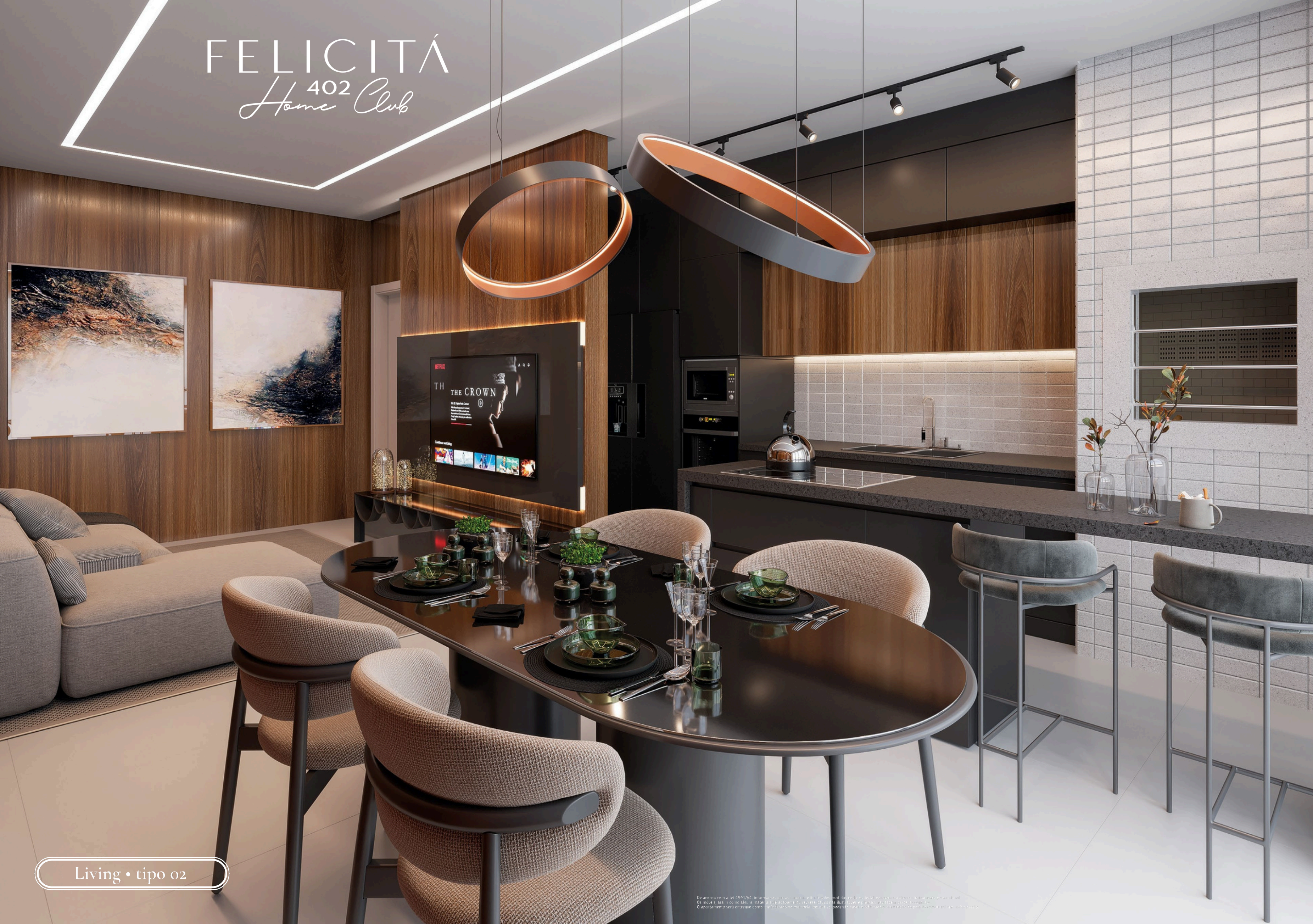
Living • tipo 02