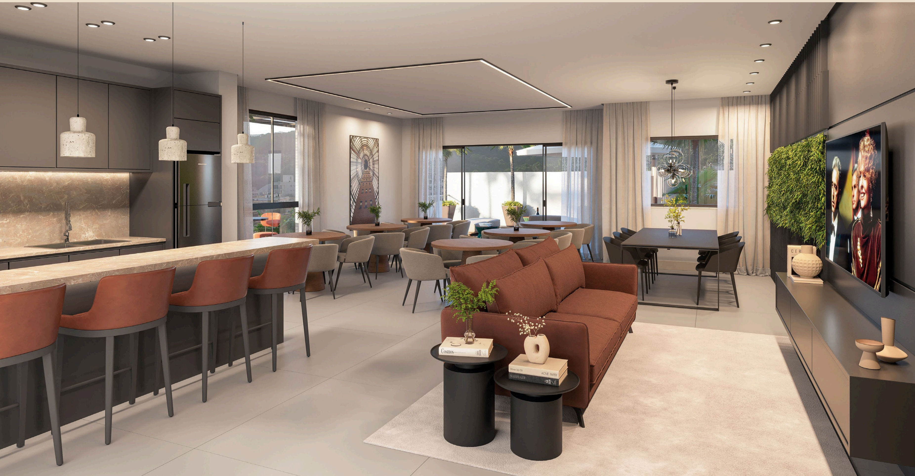
Salão de festas 02