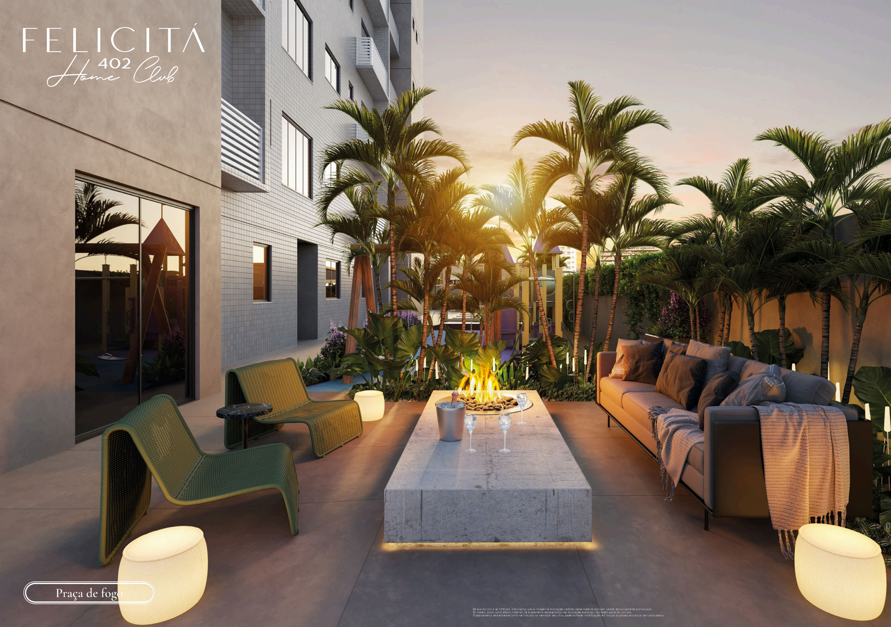
Praça de fogo

De acordo com a Lei 4591/64, informamos que as imagens e ilustrações contidas neste material possuem caráter exclusivamente promocional. Os móveis, assim como alguns materiais de acabamento representados nas ilustrações e plantas, não fazem parte do contrato. O apartamento será entregue conforme indicado no memorial descritivo, podendo haver modificações em função do projeto estrutural sem aviso prévio.