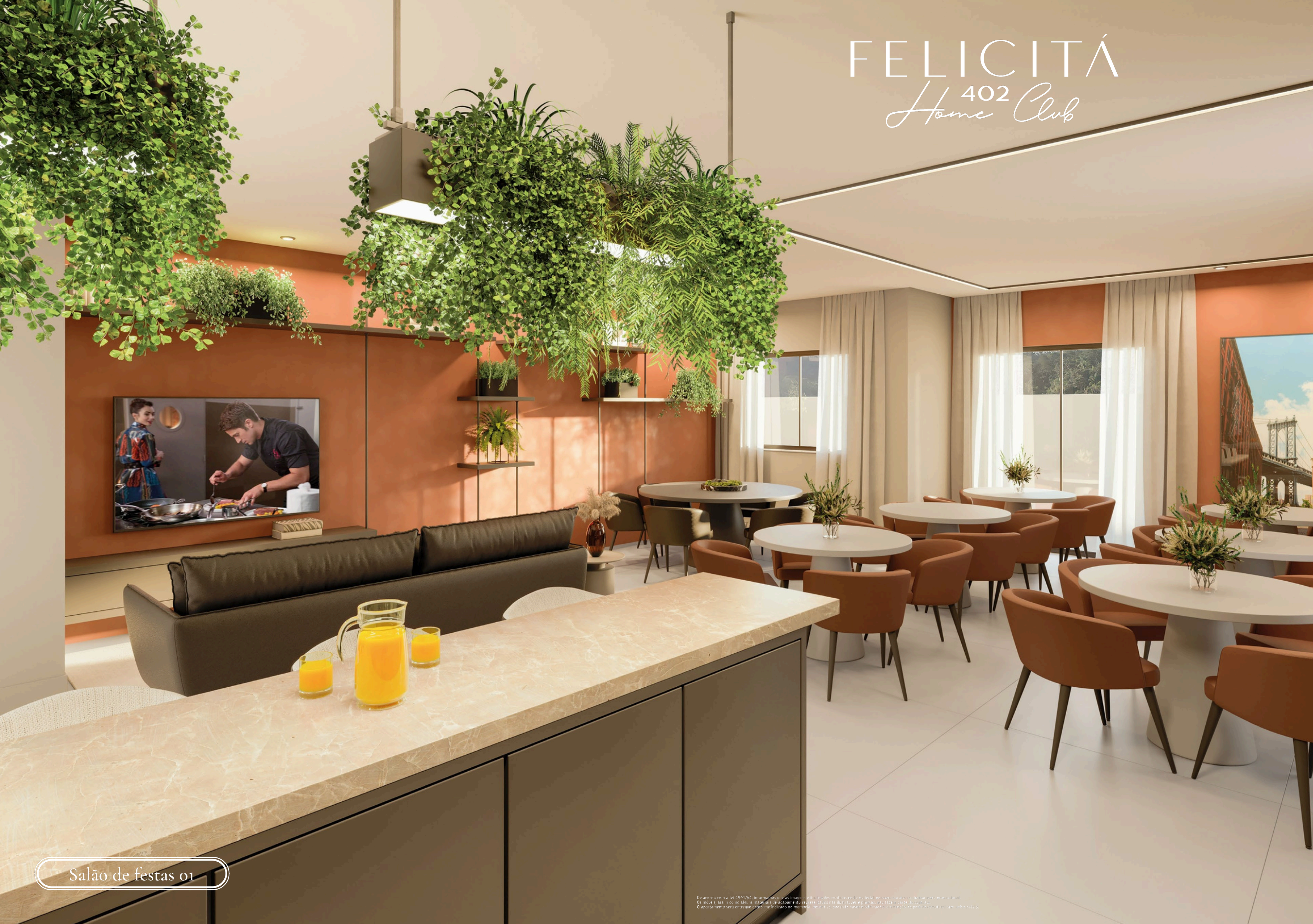
Salão de festas 01

De acordo com a Lei 4591/64, informamos que as medidas e as cores das paredes e móveis são orientativas e não vinculativas. O imóvel, assim como alguns materiais de acabamento, será entregue de acordo com o projeto de arquitetura aprovado. O apartamento será entregue conforme indicado no memorial. Não haverá custos de entrega e instalação de móveis.