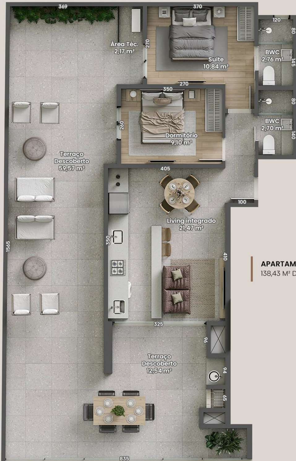
APARTAMENTO DIFERENCIADO 4 138,43 M 2 DE ÁREA PRIVATIVA